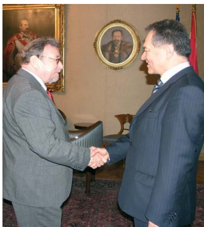
Veleposlanik Republike Crne Gore - nastupni posjet

(Zagreb, 15. veljače 2007.) Uoči prvog službenog posjeta Republici Crnoj Gori predsjednik Hrvatskoga sabora Vladimir Šeks primio je u nastupni posjet veleposlanika Republike Crne Gore Branka Lukovca