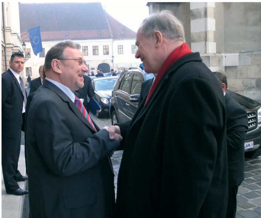
Predsjednik Hrvatskoga sabora Vladimir Šeks i predsjednik finskog parlamenta Paavo Lipponen

(Crna Gora, 19-20. veljače 2007.) Susretom s predsjednikom Skupštine Crne Gore Rankom Krivokapićem, predsjednik Hrvatskoga sabora Vladimir Šeks započeo je svoj službeni posjet Crnoj Gori. To je prvi posjet predsjednika hrvatskog parlamenta otkad je Crna Gora proglasi-