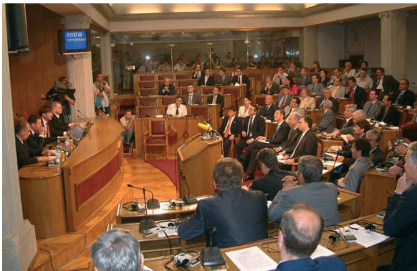
Skupština Republike Crne Gore

la neovisnost u lipnju 2006. godine i postala samostalna.