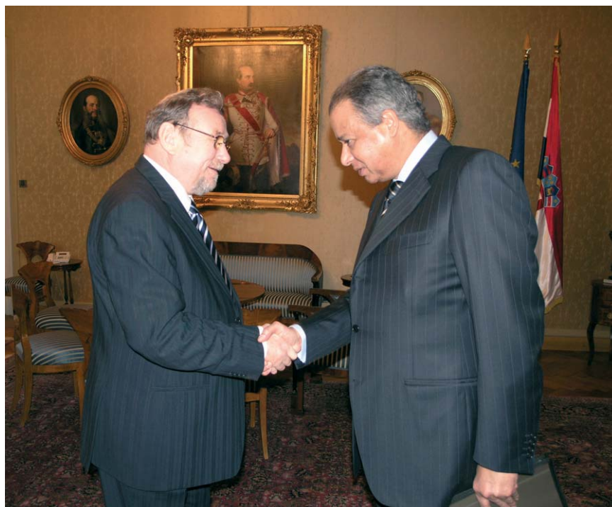
Veleposlanik Arapske Republike Egipat - nastupni posjet