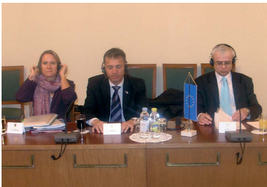
Vladimir Špidla sa članovima saborskog Nacionalnog odbora