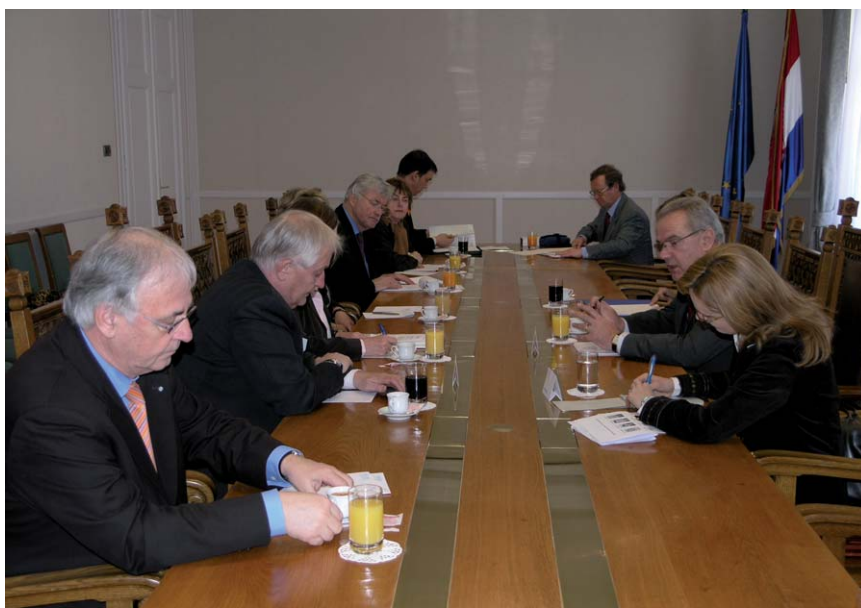
Neven Mimica primio bavorske parlamentarce