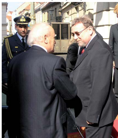
Vladimir Šeks i Karolos Papoulias

Predsjednik Hrvatskoga sabora izrazio je uvjerenje da bi trebalo ojačati parlamentarnu suradnju, u prvom redu na razini odbora za pitanja EU, što bi uvelike pomoglo Hrvatskoj na njezinom putu prema članstvu u Europskoj uniji.