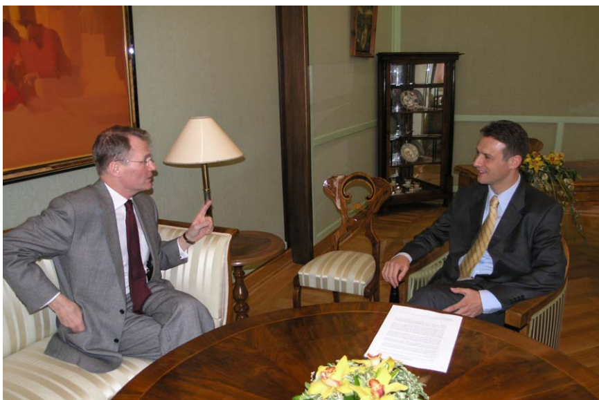
Gordan Jandroković u razgovoru s veleposlanikom Kraljevine Švedske Larsom Fredénom

Odbora za vanjsku politiku na čijem je čelu, te o radu Odbora za europske integracije i Nacionalnog odbora.