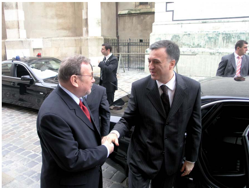
Predsjednik Hrvatskog sabora i predsjednik Republike Crne Gore