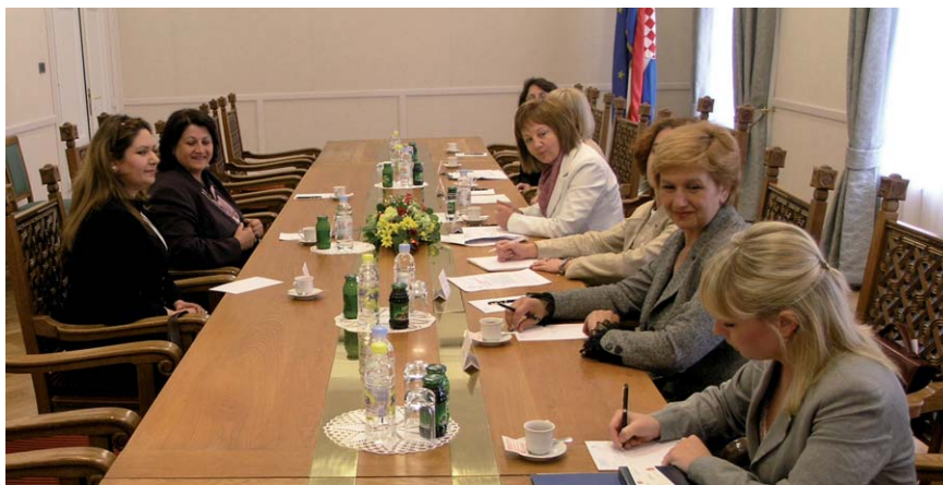
Potpredsjednica Hrvatskoga sabora Đurđa Adlešić u razgovoru sa zastupnicom iračkog parlamenta Alom Talabani

u Iraku. Obje strane bile su suglasne oko mogućnosti povezivanja žena iz različitih parlamenata kako bi se uzajamno pomagale i razmjenjivale iskustva o ženama u politici.