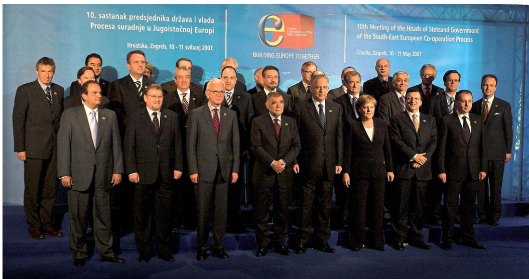
Sudionici 10. sastanka šefova država i vlada Procesu suradnje u jugoistočnoj Europi (SEECP)

Govoreći o parlamentarnoj dimenziji suradnje, istaknuo je nužnost da se slijedi glas naroda i birača, koji su se "jasno opredijelili u prilog europskih standarda i