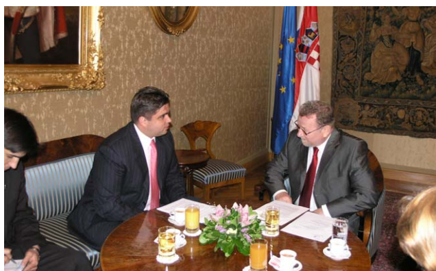
Predsjednik Sabora u razgovoru s veleposlanikom Ukrajine