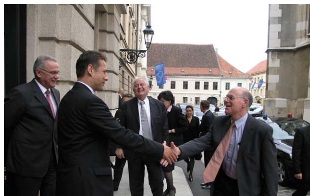
Predsjednik njemačkog Bundestaga Norbert Lammert posjetio Hrvatski sabor

visoka razina njemačkih investicija u RH kao i ukupna gospodarska razmjena. Središnje teme sastanka bile su pristupanje Hrvatske EU i proces institucionalne reforme Europske unije. Predsjednik njemačkog Bundestaga