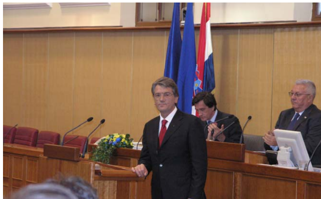
Predsjednik Ukrajine Viktor Juščenko u obraćanju zastupnicima Hrvatskoga sabora

Zagreb (31. svibnja 2007) - Predsjednik Šeks primio je predsjednika Ukrajine Viktora Juščenka u sklopu njegovog