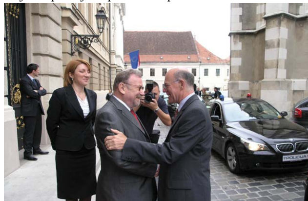
Predsjednik Hrvatskoga sabora Vladimir Šeks primio predsjednika njemačkog Bundestaga Norberta Lammerta

Šef njemačkog parlamenta je izrazio nadu da će se rješenje za postojeće poteškoće pronaći na summitu EU u