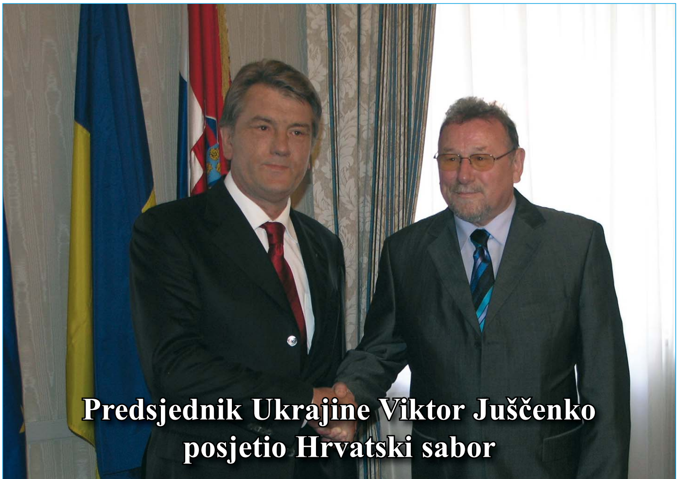
Predsjednik Ukrajine Viktor Juščenko posjetio Hrvatski sabor