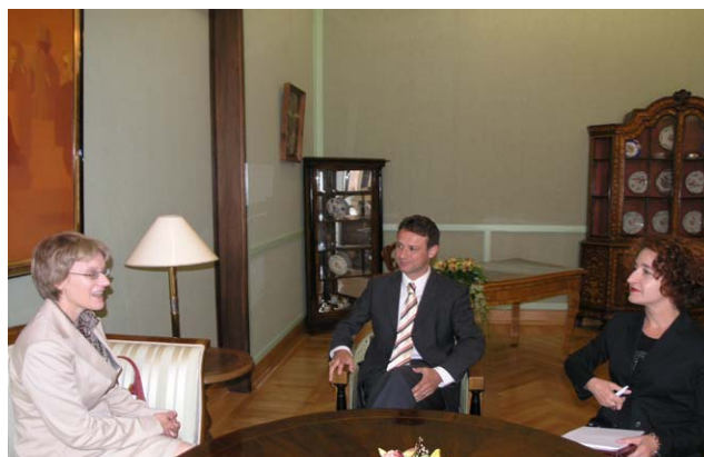
Gordan Jandroković u razgovoru s veleposlanicom Australije