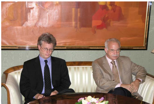
Gordan Jandroković razgovarao s veleposlanikom Kanade u Republici Hrvatskoj Thomasom Marrom

(Zagreb, 20. lipnja 2007.) Na sastanku se razgovaralo o odnosima dviju zemalja koji su ocijenjeni vrlo dobrima, kao i o procesu pristupanja Hrvatske NATO savezu, u kojem Hrvatska uživa snažnu potporu Kanade. Sugovornici su se osvrnuli i na zajedničke akcije hrvatskih i kanadskih vojnika u okviru mirovne misije u Afganistanu.