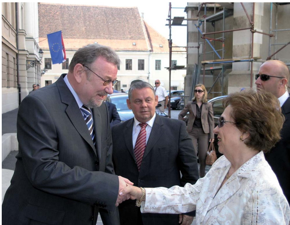
Predsjednik Hrvatskoga sabora Vladimir Šeks primio u službeni posjet predsjednicu grčkog parlamenta Annu Benaki