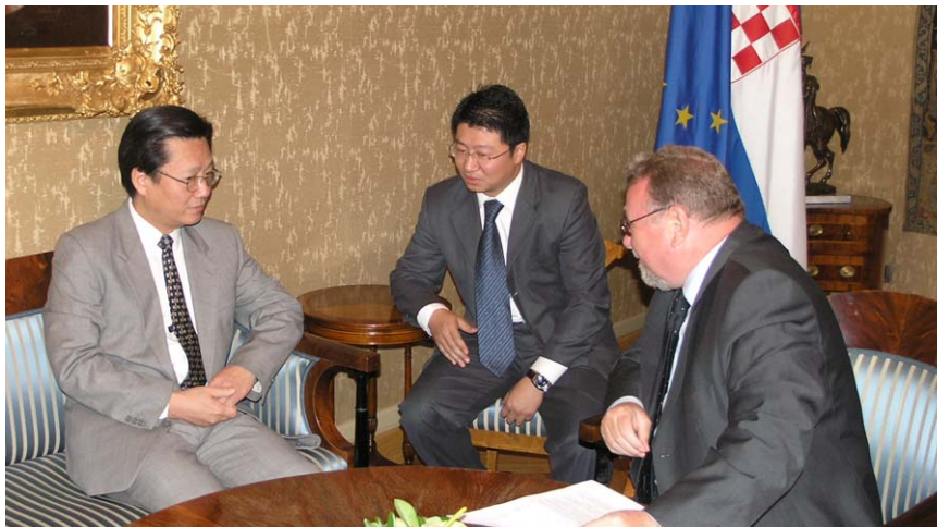
Predsjednik Hrvatskoga sabora Vladimir Šeks u razgovoru s kineskim veleposlanikom

Partnerstvo o općoj suradnji između Republike Hrvatske i Narodne Republike Kine, potpisano u svibnju 2005. godine, predstavlja odraz želja dviju država da zajedničkim naporima proširuju i produbljuju raznoliku suradnju, rekao je predsjednik Sabora Vladimir Šeks u razgovoru s kineskim veleposlanikom koji je pak izrazio želju da