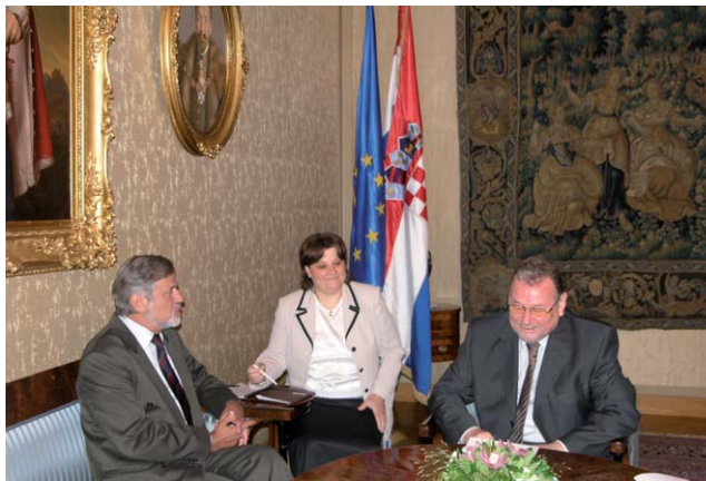
Predsjednik Hrvatskoga sabora Vladimir Šeks i mađarski veleposlanik

(Zagreb, 16. srpanj 2007.) U razgovoru je posebno istaknuto kako je u zadnje četiri godine uspostavljena tijesna parlamentarna suradnja, kruna koje je bilo potpisivanje Memoranduma o suglasnosti o strategijskom partnerstvu između Hrvatskog sabora i mađarske Naci-