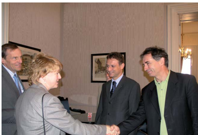
Odbor za vanjsku politiku i Hrvatsko-njemačka skupina prijateljstva sa izaslanstvom Zastupničkog doma Kongresa SAD-a

(Zagreb, 23. srpanj 2007.) Odbor za vanjsku politiku i Hrvatsko-američka skupina prijateljstva primili su u radni posjet izaslanstvo Zastupničkog doma Kongresa SAD-a.