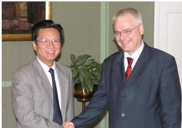
Ivo Josipović i kineski veleposlanik Wu Zhenglong

(Zagreb, 7. rujan 2007.) Veleposlanik Wu Zhenglong zahvalio je domaćinu na osobnom angažmanu u parla-