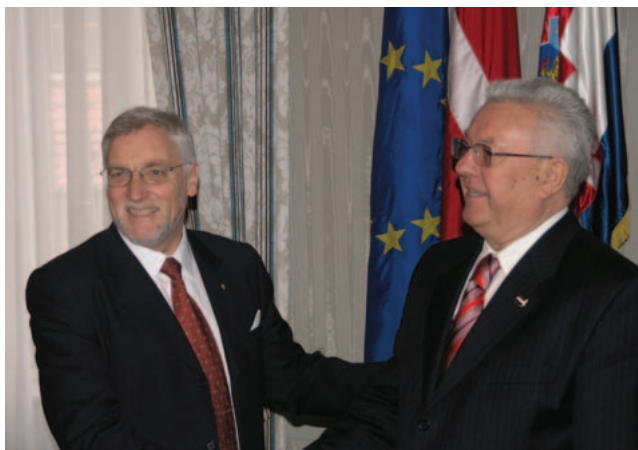
Predsjednik Sabora Luka Bebić i predsjednik parlamenta Kraljevine Danske Thor Pedersen

Odnosi dviju zemalja ocijenjeni su "odličnima", a NATO i EU bile su središnje teme razgovora s visokim izaslanstvom danskog parlamenta u kojemu su bila i tri potpredsjednika. "Razmijenili smo mišljenja i o nekim teškoćama na putu" hrvatskog učlanjenja u EU i suglasili se kako nastaviti uz "veliku i svestranu potporu" Danske, rekao je Bebić.