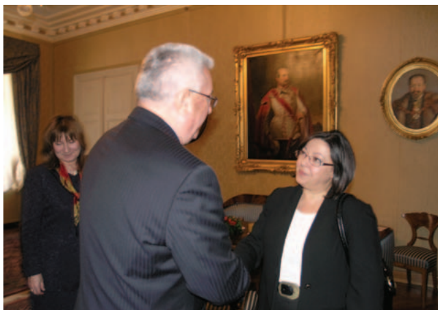
Predsjednik Sabora Luka Bebić i veleposlanica Turske Dicle Kopuz

(Zagreb, 12. ožujak 2008.) U razgovoru je obostrano istaknuto zadovoljstvo razvojem bilateralnih odnosa koji su u stalnom usponu. Uspješna suradnja je ostvarena i na regionalnom te multilateralnom planu.