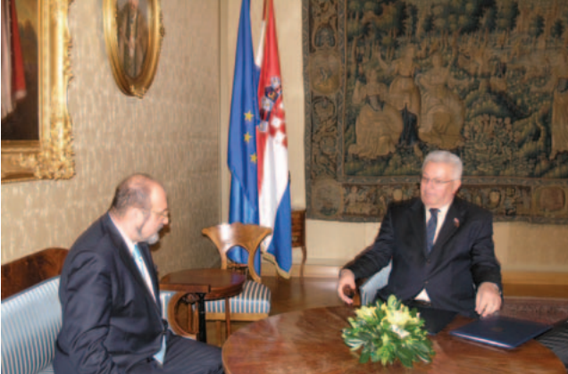
Predsjednik Sabora Luka Bebić razgovarao s veleposlanikom Slovačke republike

posebno istaknuta značajna uloga australskih Hrvata u povezivanju dviju država ne samo na političkom,