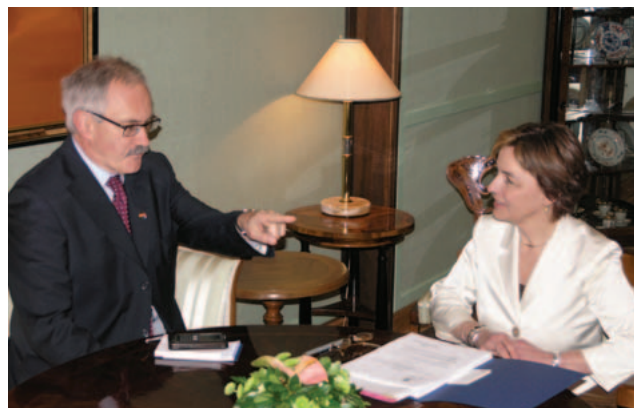
Vesna Pusić s njemačkim državnim ministrom za Europu Gloserom

Ministar Gloser drži izuzetno važnim sustavnost čitavog procesa s jedne strane, a s druge strane njegovu otvorenost javnosti. Zanimao se za postotak podrške