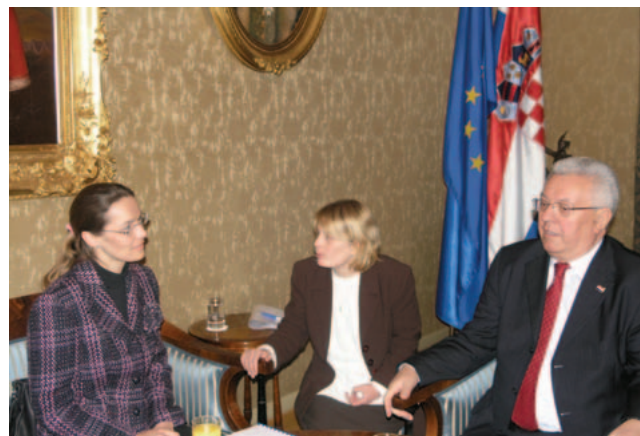
Predsjednik Hrvatskog sabora Luka Bebić sa slovačkom državnom tajnicom Dianom Štrofovom

(Zagreb, 7. ožujak 2008.) Glavne teme razgovora bile su EU i NATO. Slovačka državna tajnica kazala je kako "u NATO-u već sada postoji konsenzus oko upućivanja pozivnice RH" za prijem u članstvo, a što je jučer i potvrđeno na ministarskom sastanku NATO saveza. Do summita NATO-a u Bukureštu početkom travnja Hrvatska, Albanija i Makedonija bi trebale nastaviti s provođenjem reformi.