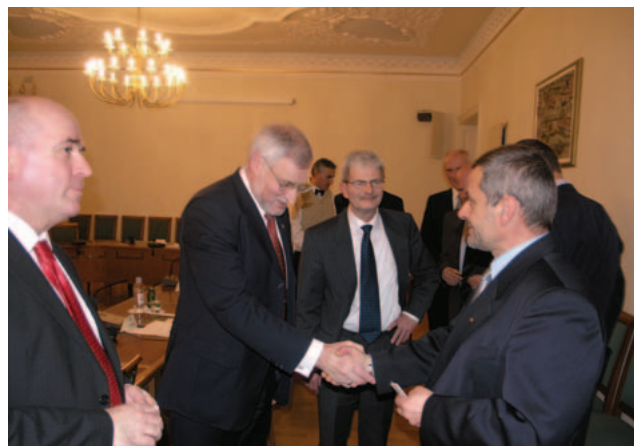
Predsjednik danskog parlamenta Thor Pedersen sa čelnicima oporbenih stranaka u Saboru

ljevine Danske Thor Pedersen upoznao je zastupnike s danskim iskustvima, istaknuvši pozitivne učinke zajedničkog nastupa svih parlamentarnih stranaka, kako u fazi pregovora s EU, tako i kasnije u statusu zemlje članice. U okviru razgovora o potpori javnosti ulasku Hrvatske u EU, sugovornici su se složili kako je potrebna efikasnija komunikacijska strategija koja će jasno i precizno informirati građane o tome što za njih znači članstvo Hrvatske u EU.