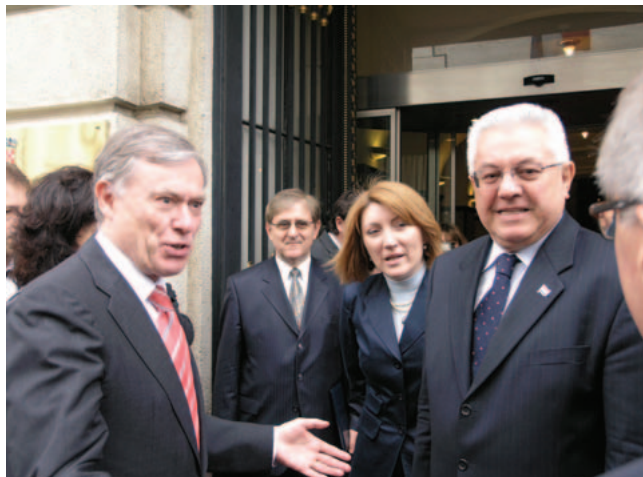
Predsjednik Sabora Bebić primio njemačkog predsjednika Köhlera

zio očekivanje da Hrvatska nastavi sa svim nužnim reformama. Pozivnicu Hrvatskoj za ulazak u NATO predsjednik Köhler je istaknuo kao najvidljiviji pokazatelj svega što je Hrvatska već do sada postigla, te njezinih dobrih perspektiva u budućnosti.