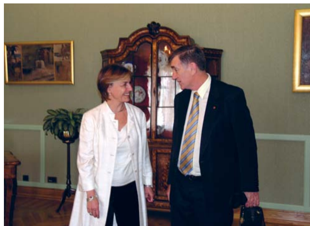
Vesna Pusić s predsjednikom australskog Senata Hoggom

Predsjednica Odbora Vesna Pusić informirala je goste o aktivnostima provođenja reformi te njihovoj implementaciji u hrvatsko zakonodavstvo, a kao najvažnija područja reformi izdvojila je brodogradnju, pravosuđe, javnu upravu i tržišno natjecanje. Naglasila je da je aktivnija komunikacija sa cjelokupnom javnošću od iznimnog značaja za pregovarački proces s EU kako bi se on odvijao transpa-