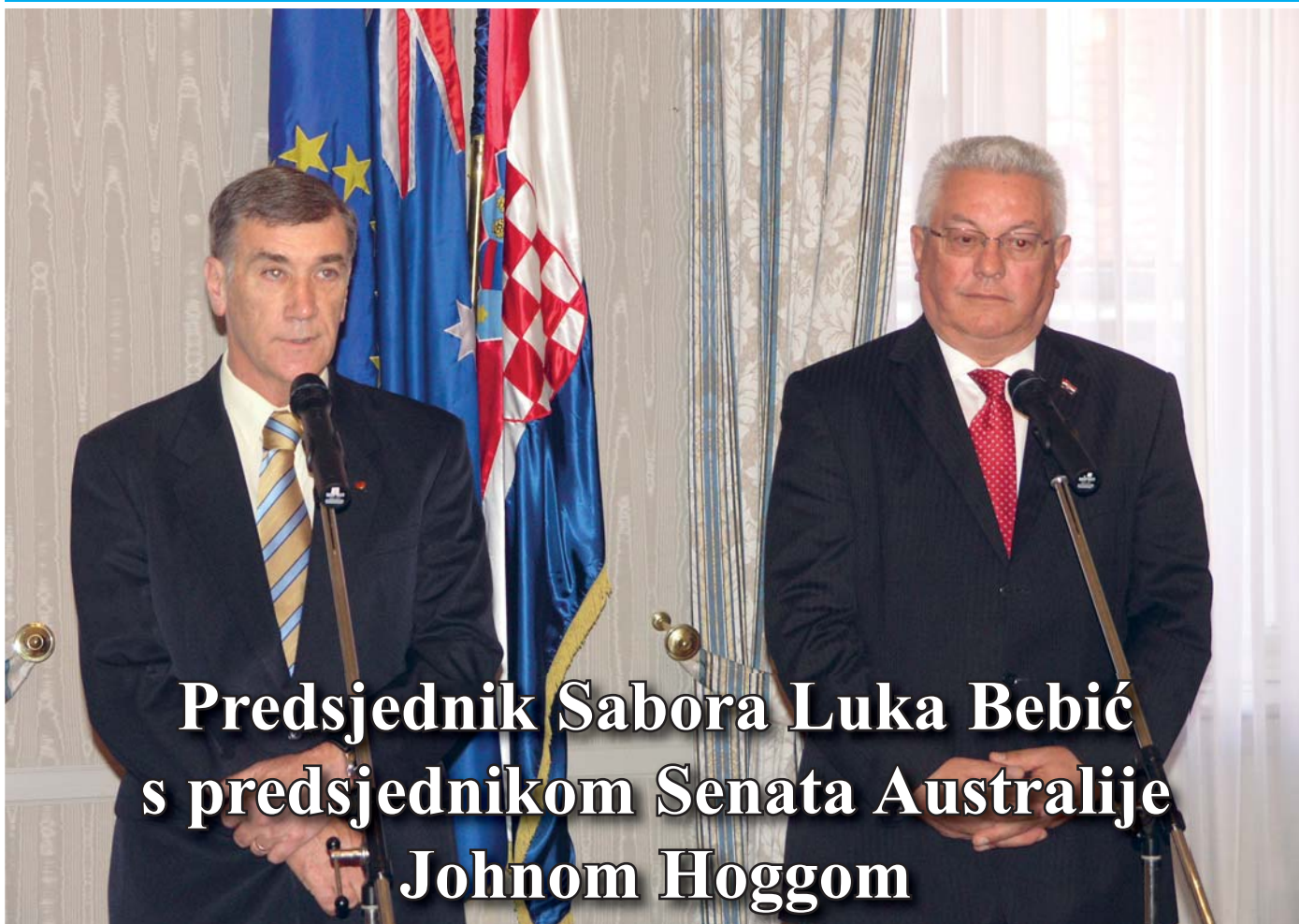
Predsjednik Sabora Luka Bebić s predsjednikom Senata Australije Johnom Hoggom