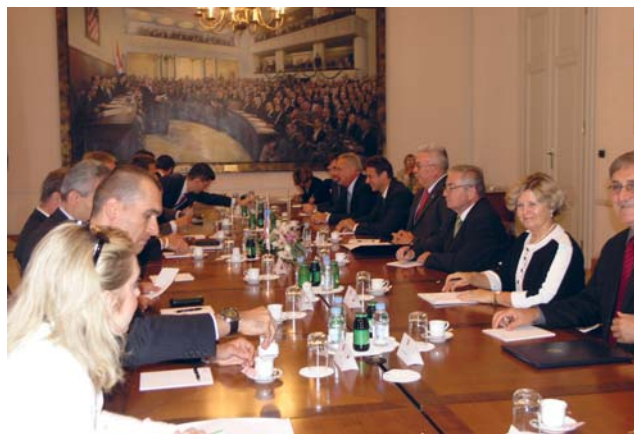
Predsjednik Hrvatskoga sabora Luka Bebić primio predsjednika Vlade Republike Češke Mireka Topolaneka