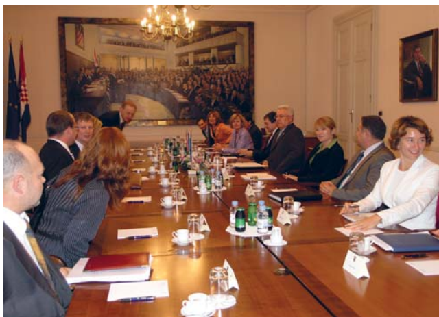
Luka Bebić i predsjednik estonske vlade Andrus Ansip

Estoni je predsjednik Vlade Ansip rekao kako Estonija snažno podržava daljnje proširenje Europske