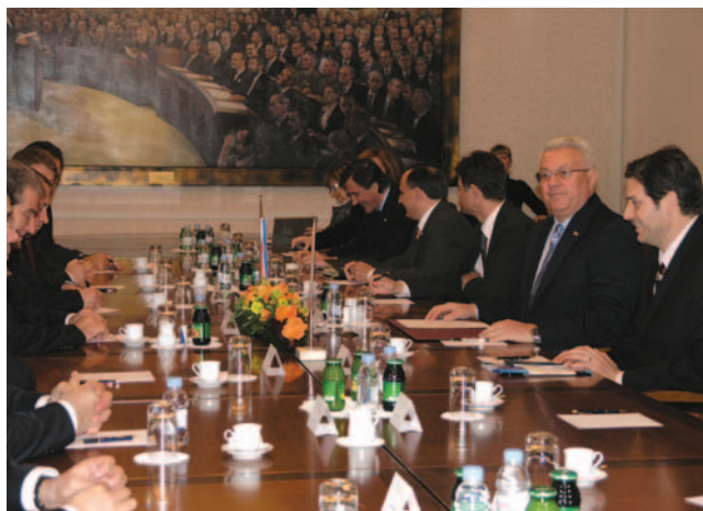
Predsjednik Hrvatskoga sabora Bebić s predsjednikom Vijeća ministara Republike Albanije Berishom

Predsjednik albanskog Vijeća ministara Sali Berisha je rekao kako je Hrvatska prijateljska zemlja koja je Albaniji uvijek pružala podršku. Istaknuo je kako je članstvo Hrvatske u Europskoj uniji važna poruka za cijelu regiju, te je izrazio svoje zadovoljstvo ovim posjetom Hrvatskoj, ne samo u političkom smislu, nego i u pogledu gospodarske suradnje jer su dogovoreni brojni projekti na području energetike, prometnog povezivanja i građevinarstva.