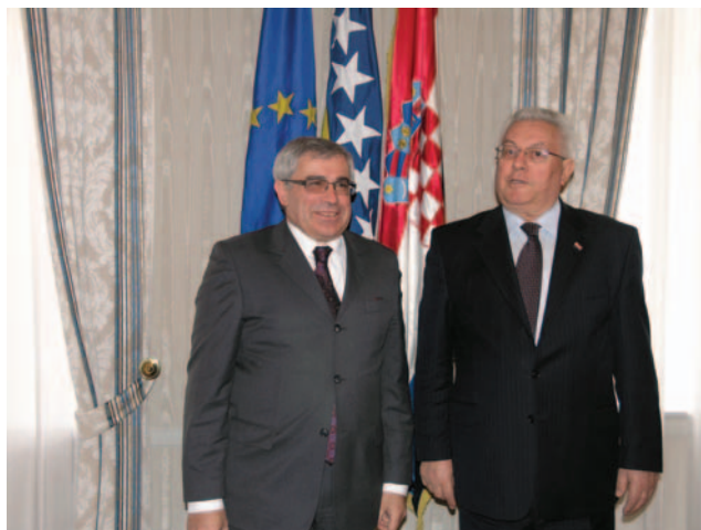
Predsjednik Sabora Bebić i ministar vanjskih poslova BiH Sven Alkalaj

(Zagreb, 16. veljače 2009.) Dvojica su dužnosnika razgovarala o ukupnim bilateralnim odnosima koje su ocijenili prijateljskima, dinamičnima i dobrosusjedskima.