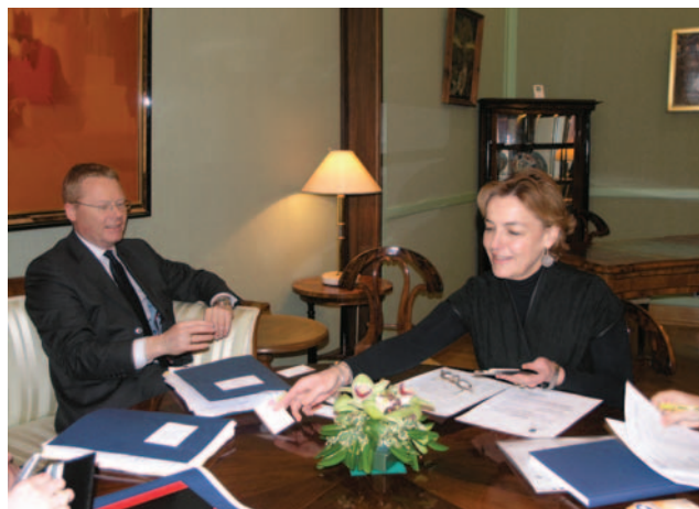
Vesna Pusić s dužnosnikom danskog Ministarstva vanjskih poslova Jørgensenom

Podtajnik Jørgensen kazao je kako Danska od samih početaka podupire RH na njezinom putu prema EU i NATO-u. Bilateralni odnosi dviju zemalja zadovoljavajuću su i nema otvorenih pitanja. Kim Jørgensen istaknuo je da očekuje kako će Hrvatska premostiti trenutačne prepreke i u bliskoj budućnosti postati punopravna članica Europske unije. Obje su strane suglasne da se Republika Hrvatska treba aktivno baviti dovršenjem zadanih reformi kako bi što uspješnije dovršila pregovore s Europskom unijom.