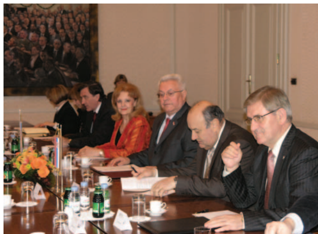
Predsjednik Hrvatskoga sabora primio predsjednika Skupštine Autonomne Pokrajine Vojvodine Šandora Egerešija

Predsjednik Hrvatskoga sabora Bebić ocijenio je kako su takvi razgovori dobar put u razvoju ukupnih bilateralnih odnosa, te je podržao da se nastave voditi i u budućnosti. Ponudio je mogućnost suradnje Hrvatskog sabora i u okviru priprema za europske integracije. Posebno je pozdravio prekograničnu i regionalnu suradnju koju Hrvatska, odnosno neke od njenih županija, imaju sa Srbijom, odnosno Vojvodinom, naglasivši kako je upravo taj oblik suradnje visoko na vrijednosnoj ljestvici Europske unije. U vezi s time, Hrvatska pomno prati usvajanje Statuta AP Vojvodine, rekao je predsjednik Sabora Bebić.