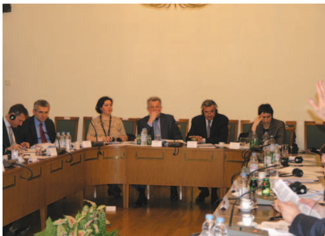
Supredsjedatelji Odbora Mario Zubović i Pal Schmitt

Ministar pravosuđa Ivan Šimonović upoznao članove Odbora s naporima koje Hrvatska poduzima na planu borbe protiv organiziranog kriminala i korupcije u Hrvatskoj. Naglasio je kako je ta borba dio šireg konteksta reforme pravosuđa i podizanja njegove kvalitete, u normativnom i organizacijskom dijelu, ali i kadrovskim poboljšanjima. Cilj je funkcionalna integracija policije, Državnog odvjetništva i sudova u učinkovit sustav koji će se znati oduprijeti korupciji i organiziranom kriminalu. Ne manje važna je široka podrška javnosti, nevladinih udruga, akademske zajednice i čitavog društva, istaknuo je Šimonović.