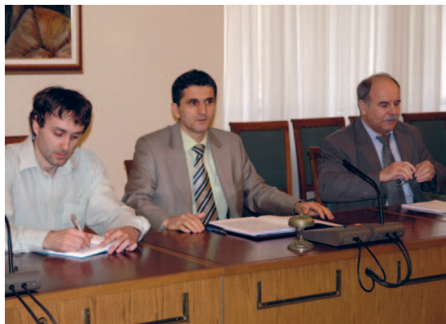
Predsjednik Odbora za financije i državni proračun Goran Marić s predstavnicima SIGMA-e

(Zagreb, 2. travnja 2009.) Predsjednik Odbora za financije i državni proračun Hrvatskoga sabora Goran Marić održao je sastanak s predstavnicima SIGMA-e, institucije pri Europskoj komisiji koja pomaže razvoju sustava unutarnjih financijskih kontrola u javnom sektoru.