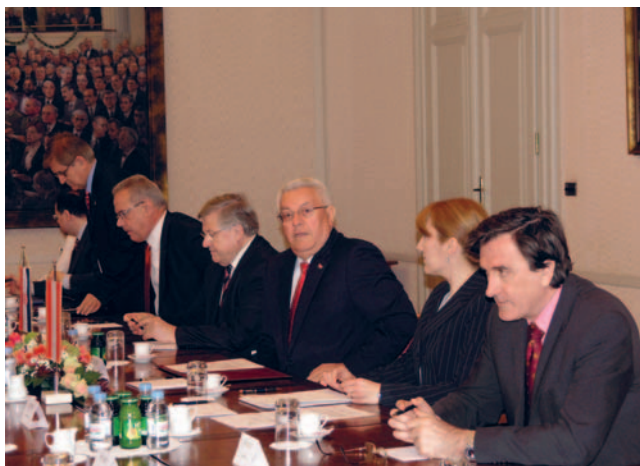
Predsjednik Sabora Bebić s austrijskim ministrom Michaelom Spindeleggerom

Glavni naglasak razgovora je bio na mogućnostima intenziviranja gospodarske suradnje, za koju postoji snažan interes u obje države. Katar je posebno zainteresiran za izgradnju terminala za ukapljeni plin u Hrvatskoj kao i suradnju na području brodogradnje s obzirom na to da ima potrebu za brodovima za transport plina i naftnih proizvoda, a razmatrale su se i mogućnosti ulaganja u hrvatski turizam.