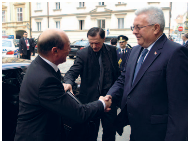
Predsjednik Hrvatskoga sabora Luka Bebić razgovarao s predsjednikom Rumunjske Traianom Basescuom

Rumunjski je predsjednik čestitao Hrvatskoj na ulasku u NATO nazvavši to „ekstremno važnim korakom” jer NATO jamči mir. Izrazio je želju da Hrvatska što prije uđe u Europsku uniju kao i osobno uvjerenje da se bilateralni spor oko hrvatsko-slovenske granice treba riješiti na temelju međunarodnog prava. Istaknuo je kako u Europskoj uniji parlamenti imaju važnu ulogu jer tijesne veze s parlamentima država članica EU mogu olakšati ulazak države kandidatkinje podržavši time suradnju parlamenata.