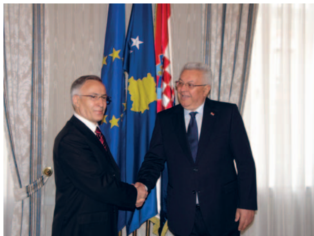
Predsjednik Luka Bebić s predsjednikom Skupštine Republike Kosovo Krasniqijem