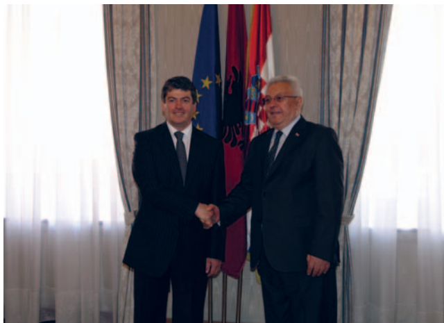
Predsjednik Hrvatskoga sabora Luka Bebić i predsjednik Republike Albanije Bamir Topi

(Zagreb, 21. svibnja 2009.) Predsjednik Hrvatskoga sabora Luka Bebić primio je predsjednika Republike Albanije Bamira Topija u sklopu njegovog službenog posjeta Republici Hrvatskoj. Dvojica su dužnosnika razgovarala o ukupnim bilateralnim odnosima koji su prijateljski, a nakon što su Hrvatska i Albanija zajedno primljene u NATO, dvije su države postale partneri. Zaključeno je kako je članstvo u NATO-u od velikog značenja za održavanje mira i stabilnosti na području jugoistočne Europe.