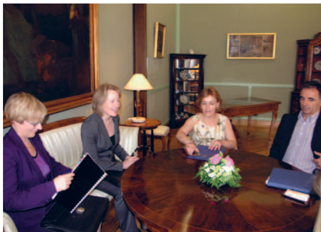
Vesna Pusić i Milorad Pupovac s dužnosnicom Ministarstva vanjskih poslova Australije Jane Duke

Ravnateljica Odjela za sjevernu, južnu i istočnu Europu u Ministarstvu vanjskih poslova Australije Jane Duke kazala je da su bilateralni odnosi dviju zemalja prijateljski i bez otvorenih pitanja. Jane Duke uputila je čestitke Hrvatskoj za članstvo u NATO-u, a podupire i članstvo Hrvatske u Europskoj uniji.