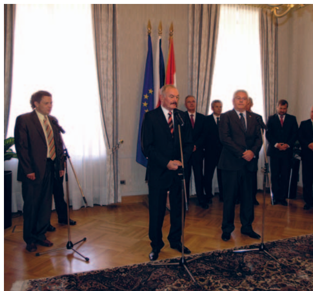
Predsjednik Luka Bebić s predsjednikom češkog parlamenta

Dvojica dužnosnika razgovarala su o bilateralnim odnosima ustvrdivši da su oni prijateljski i bez otvorenih pitanja. „Naš je jedini problem ubrzanje pristupanja Hrvatske u EU”, rekao je Sobotka dodajući da će o hrvatsko-slovenskom sporu koji blokira pristupne pregovore razgovarati s kolegama iz srednje Europe i ostalima. Bebić je zahvalio Češkoj na potpori u pristupanju EU-u i NATO-u i posebno pozdravio stav Praga kako je potrebno jačati suradnju EU-a s jugoistokom Europe.