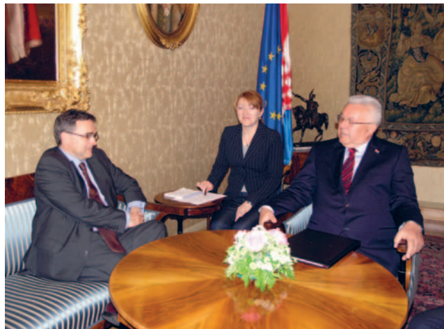
Predsjednik Hrvatskoga sabora Bebić primio veleposlanika Francuske Republike François Saint-Paula

Predsjednik Hrvatskoga sabora Bebić zahvalio je Francuskoj na potpori ulasku Hrvatske u Europsku uniju i NATO. Podržao je daljnju suradnju u okviru Frankofonije i Unije za Mediteran istaknuvši kako one imaju dalekosežni značaj za povezivanje različitih zemalja, kultura i civilizacija, posebice na području Sredozemlja. Francuski veleposlanik Saint-Paul posebno je izrazio zadovoljstvo razvojem gospodarskih odnosa, te ponudio suradnju i stručnu pomoć Francuske Hrvatskoj na području ener-