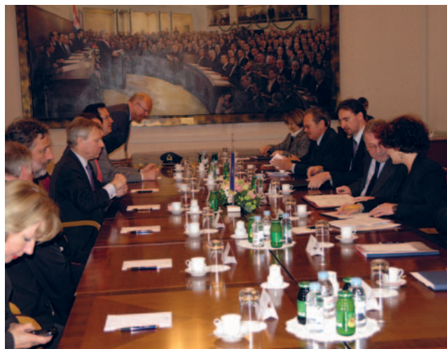
Potpredsjednik Sabora Vladimir Šeks i glavni tajnik NATO-a Jaap de Hoop Scheffer

(Zagreb, 7. svibnja 2009.) Potpredsjednik Hrvatskoga sabora Vladimir Šeks glavnom je tajniku NATO-a čestitao na visokom hrvatskom odličju koje mu je uručeno „za predani rad i zasluge za Hrvatsku”. Istaknuo je kako je Hrvatska ulaskom u NATO ostvarila jedan od svoja dva najvažnija vanjskopolitička cilja te je glavnom tajniku NATO-a zahvalio na podršci koju je pružio Hrvatskoj na tom putu, prije svega u procesu ratifikacije Protokola o proširenju Sjevernoatlantskog ugovora na Hrvatsku u nacionalnim parlamentima država članica NATO-a. Potpredsjednik Hrvatskoga sabora Vladimir Šeks potvrdio je da je Hrvatska predana načelu kolektivne obrane, što je osnovna svrha i najvažnija zadaća Saveza, kao i da