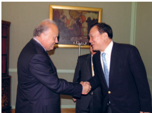
Slavko Linić primio u posjet zastupnika u parlamentu Republike Koreje Sang-euna Parka

Sugovornici su uvodno konstatirali da su odnosi dviju zemalja dobri, ali i da postoji veliki prostor za unapređenje suradnje na svim poljima. Sang-eun Park izvijestio je domaćina da je ove godine formirana Korejsko-hrvatska skupina prijateljstva u korejskom parlamentu. Sugovor-