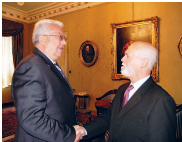
Predsjednik Sabora s veleposlanikom Države Izrael

Predsjednik Sabora Luka Bebić i izraelski veleposlanik Shmuel Meirum su razgovarali i o izraelsko-palestinskim odnosima kao i o hrvatskom pristupanju Europskoj uniji, koje je izraelski veleposlanik snažno podržao izrazivši uvjerenje da će Hrvatska vrlo skoro postati članicom Europske unije.