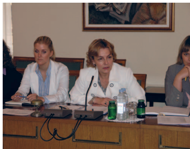
Vesna Pusić primila članove Radne skupine za proširenje Vijeća EU

Članovi radne skupine za proširenje Vijeća EU složili su se kako je potrebno što prije doći do rješenja problema Hrvatske i Slovenije dok će Europska unija sa svoje strane pokušati osigurati okvir za njegovo rješavanje. Na sastanku je bilo riječi i o reformi brodogradnje, koja je posebno teška i osjetljiva u vrijeme gospodarske krize.