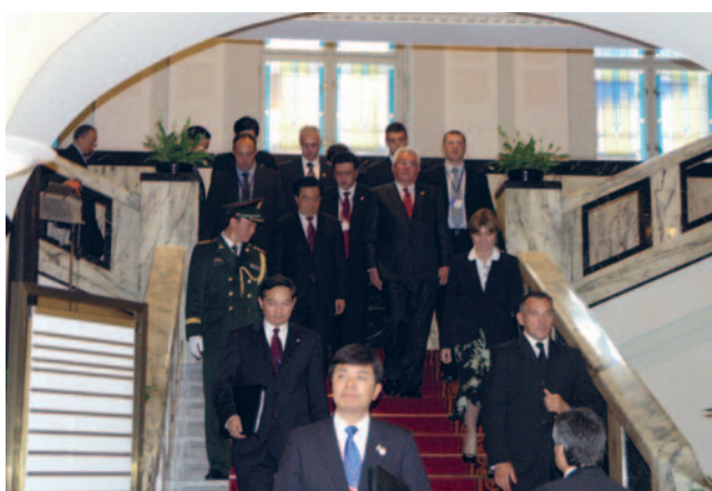
Predsjednik Hrvatskoga sabora Luka Bebić i kineski predsjednik Hu Jintao

(Zagreb, 20. lipnja 2009.) Predsjednik Hrvatskoga sabora Luka Bebić primio je predsjednika Narodne Republike Kine Hua Jintaoa, koji u Hrvatskoj boravi u prvom službenom posjetu od proglašenja neovisnosti Hrvatske.