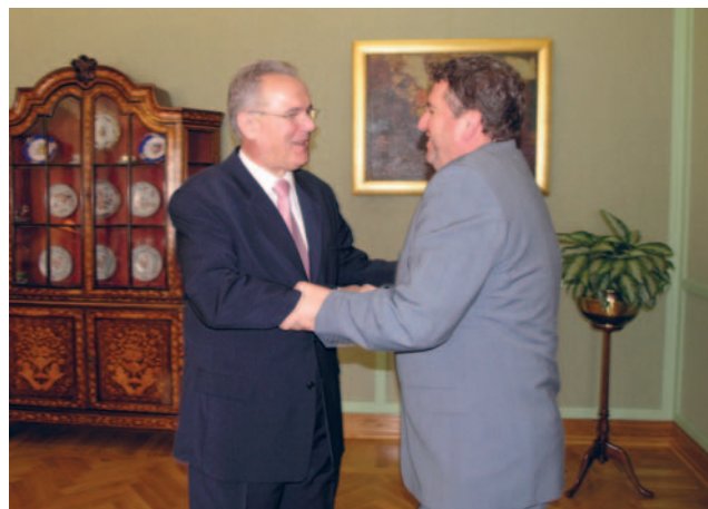
Neven Mimica primio veleposlanika Republike Mađarske Pétera Györkösa