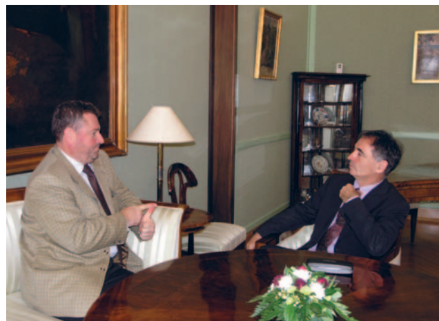
Milorad Pupovac sastao se s mađarskim veleposlanikom Györkösom

Promatrajući ulogu Hrvatske u regiji, Pupovac je istaknuo kako je Hrvatska dobro krenula razvijati regionalnu dimenziju u svojoj vanjskoj politici, iako neki posljednji primjeri dovode u pitanja ta postignuća. „Čini mi se da bi bilo dobro, kao što postoji suradnja zemalja u regiji kada su u pitanju policijski poslovi ili suradnja tužilaštva, da takva suradnja postoji i na području povratka izbjeglica i zaštite manjina, čega zasad nema”. Potrebno je da Hrvatska na Jugoistoku Europe pronađe relevantne partnere kako bi se Europskoj uniji, već zasićenoj proširenjem, mogao odaslati jasan signal da su zemlje regije spremne preuzeti svoj dio odgovornosti u kreiranju zajedničke europske budućnosti. Ta šansa dosad nije iskorištena u bilateralnim odnosima s nama susjednim zemljama, a potencijalnim partnerima, a bilo je mogućnosti za to, rekao je Pupovac.