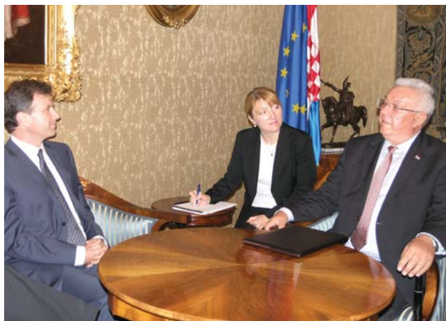
Predsjednik Sabora Bebić i veleposlanik SAD-a James B. Foley

(Zagreb, 21. rujna 2009.) Predsjednik Hrvatskoga sabora Luka Bebić primio je u nastupni posjet veleposlanika Sjedinjenih Američkih Država Jamesa B. Foley, s kojim je razgovarao o bilateralnim odnosima, članstvu u NATO-u, pristupanju Hrvatske Europskoj uniji i ukupnom stanju u regiji.