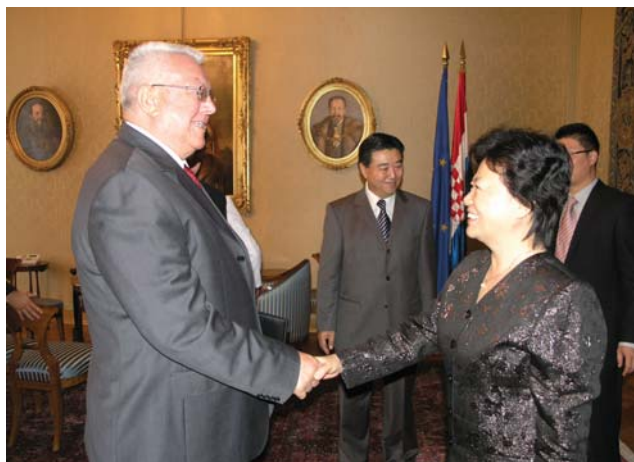
Predsjednik Hrvatskoga sabora primio načelnicu i glavnu tajnicu KPK Ureda za vanjske poslove Yangzhoua Ding Zhanghue

(Zagreb, 30. rujna 2009.) Predsjednik Hrvatskoga sabora Luka Bebić primio je načelnicu i glavnu taj-