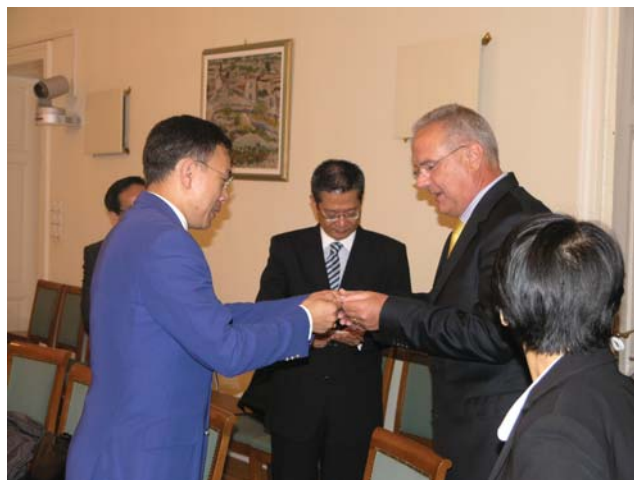
Potpredsjednik Sabora Neven Mimica s izaslanstvom Zakonodavnog vijeća posebne upravne oblasti Hong Konga

(Zagreb, 25. rujna 2009.) Privremeni otpravnik poslova David Hudson upoznao je Nevena Mimicu s predstojećim promjenama u Delegaciji Europske komisije u Hrvatskoj. Također je najavio usvajanje Izvješća o napretku Hrvatske za 14. listopada. Sugovornici su razgovarali o