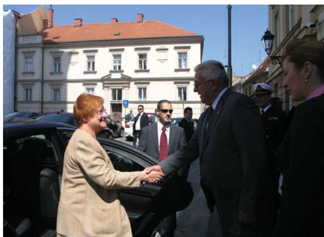
Predsjednik Sabora Luka Bebić i predsjednica Republike Finske Tarja Halonen

Predsjednica Finske Tarja Halonen je naglasila važnost implementacije zakonodavstva te je ukazala na to da treba uvijek provjeriti mogućnost provedbe zakona u praksi. Pohvalila je napredak Hrvatske i izrazila uvjerenje da će Hrvatska i Slovenija pronaći rješenje za granični spor. Posebna pažnja u razgovoru dvoje dužnosnika bila je posvećena borbi protiv korupcije i organiziranog kriminala u Hrvatskoj. Podsjetivši na nedavni ustroj četiri specijalizirana suda predsjednik Sabora je istaknuo kako Hrvatska stvara pravni okvir. Izrazio je nadu da je Hrvatska na pravom putu. S finskom predsjednicom se suglasio