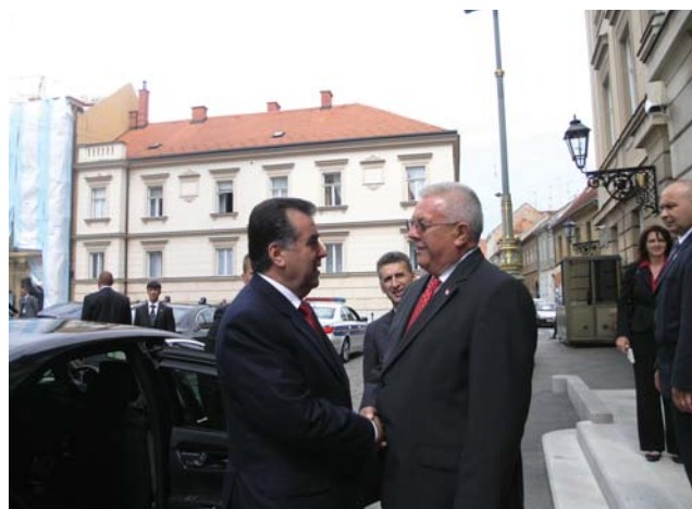
Predsjednik Sabora Luka Bebić i predsjednica Republike Finske Tarja Halonen

Dvojica su dužnosnika razgovarala o bilateralnim odnosima koji su dobri i bez otvorenih pitanja. Izraženo je zadovoljstvo time što su odnosi podignuti na višu razinu. Obje su strane snažno zainteresirane za tješnju suradnju, ne samo na bilateralnom planu nego i u međunarodnim okvirima, potvrđeno je tijekom razgovora predsjednika Sabora Bebića i tadžikistanskog predsjednika Rahmonija. Izražena je želja da suradnju uspostave i parlamenti dviju država te da se osnuju skupine prijateljstva. Predsjednik Sabora rekao je kako Hrvatska želi intenzivirati suradnju sa srednjoazijskim državama, a predsjednik Tadžikistana istaknuo je značaj Hrvatske u sklopu suradnje Tadžikistana s europskim državama, koja u vanjskoj politici ove države srednje Azije ima prioritet. Zaključeno je kako mogućnosti