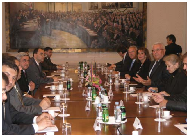
Predsjednik Luka Bebić primio predsjednika Republike Armenije Serzha Azatija Sargsyana

(Zagreb, 8. rujna 2009.) Predsjednik Hrvatskoga sabora Luka Bebić primio je predsjednika Republike Armenije Serzha Azatija Sargsyana u sklopu njegovog službenog posjeta Republici Hrvatskoj. Dvojica su dužnosnika razgovarali o tome kako unaprijediti suradnju dviju zemalja. Hrvatska i Armenija dijele zajedničke interese očuvanja mira, širenja demokratskih sloboda, poticanja ekonomskog razvoja te slijede iste vanjskopolitičke ciljeve, europske i euroatlantske integracije.