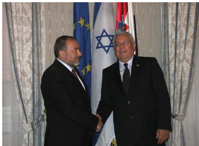
Predsjednik Sabora s izraelskim potpredsjednikom vlade i ministrom vanjskih poslova Libermanom

Posebna pozornost u razgovoru dvojice dužnosnika bila je posvećena razvoju gospodarske suradnje. Izraelski ministar Liberman zauzeo se za osnivanje svojevrsnog foruma gospodarstvenika i ljudi iz politike u cilju uklanjanja birokratskih prepreka koje koče razvoj suradnje na tom području. Rekao je i kako Izrael cijeni to što Hrvatska obilježava Dan sjećanja na Holokaust. U nastavku razgovora bilo je riječi o ukupnoj situaciji na području