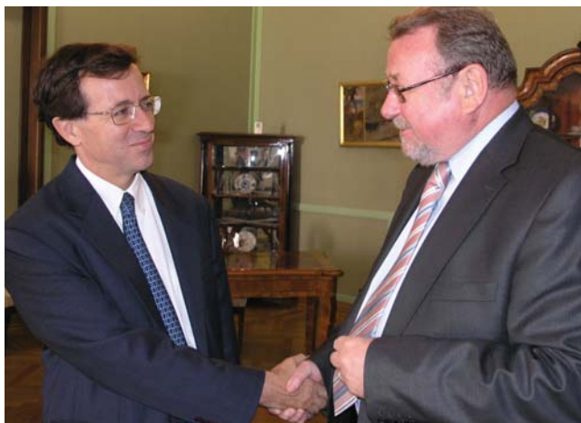
Potpredsjednik Hrvatskoga sabora Vladimir Šeks primio veleposlanika Republike Francuske Jeromea Pasquiera

(Zagreb, 22. rujna 2009.) Sugovornici su razgovarali o aktualnoj političkoj situaciji u Hrvatskoj s posebnim osvrtom na odnose sa Slovenijom. Potpredsjednik Hrvatskoga sabora Vladimir Šeks rekao je da sporazum Ljubljana–Zagreb predstavlja „povijesni kompromis i pobjedu europske ideje”. Deblokadom pregovora Republike Hrvatske otvorit će se niz pregovaračkih poglavlja, a utvrdit će se i modaliteti rješavanja graničnog spora, istaknuo je Vladimir Šeks. Veleposlanik Pasquier podsjetio je da se Francuska intenzivno zalaže za što skorije pristupanje Hrvatske Europskoj uniji te pozdravlja novonastali dogovor sa Slovenijom.