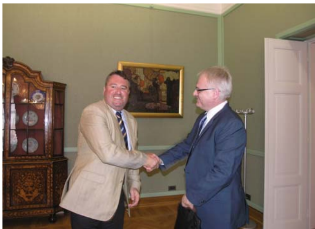
Potpredsjednik Odbora za pravosuđe Ivo Josipović s veleposlanikom Republike Mađarske Péterom Györköšem

(Zagreb, 14. rujna 2009.) Razgovaralo se o aktualnoj političkoj situaciji u Hrvatskoj, posebice u svjetlu nado-