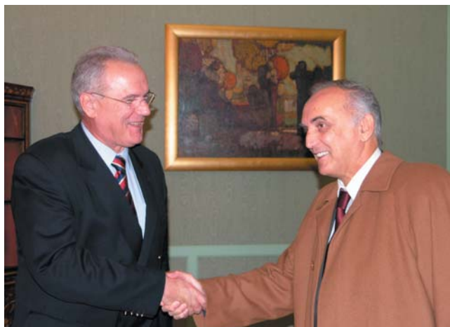
Potpredsjednik Mimica primio ministra savjetnika u Veleposlanstvu Republike Srbije Zorana Popovića

(Zagreb, 19. listopada 2009.) Potpredsjednik Hrvatskoga sabora i predsjednik Odbora za europske integracije Hrvatskoga sabora Neven Mimica primio je u radni posjet ministra savjetnika u Veleposlanstvu Republike Srbije u Republici Hrvatskoj Zorana Popovića.