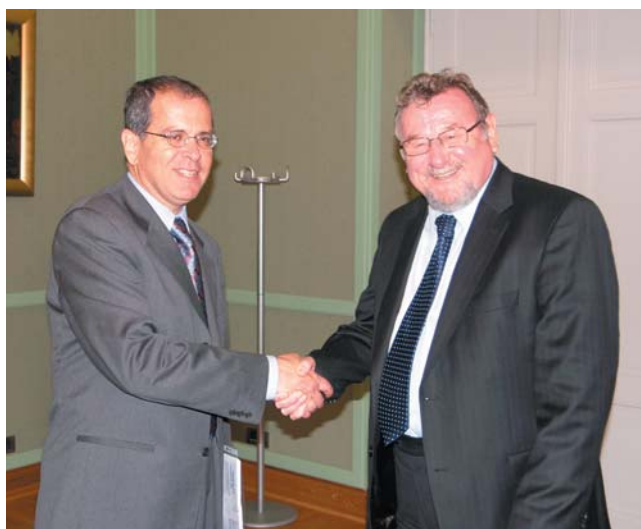
Potpredsjednik Šeks primio izraelskog veleposlanika Amranija

(Zagreb, 12. listopada 2009.) Potpredsjednik Hrvatskoga sabora i predsjednik Odbora za Ustav, Poslovnik i politički sustav Hrvatskoga sabora Vladimir Šeks primio je u nastupni posjet veleposlanika Države Izrael u Republici Hrvatskoj Yosefa Amranija.