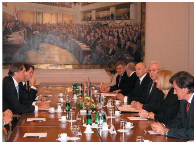
Predsjednik Sabora Luka Bebić i predsjednik Skupštine Crne Gore Krivokapić