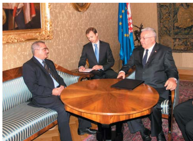
Predsjednik Bebić primio u nastupni posjet ruskog veleposlanika

(Zagreb, 9. listopada 2009.) Predsjednik Hrvatskoga sabora Luka Bebić primio je u nastupni posjet veleposlanika Ruske Federacije u Republici Hrvatskoj Roberta Markaryana.