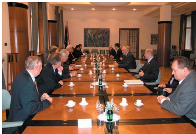
Potpredsjednik Sabora Josip Friščić s izaslanstvom bavarskoga parlamenta

Čvrste i prijateljske hrvatsko-njemačke odnose sugovornici su ocijenili kao podlogu za daljnju svekoliku suradnju na svim područjima, osobito u svjetlu budućeg punopravnog članstva Republike Hrvatske u Europskoj uniji, pri čemu je potpredsjednik Friščić iskazao uvjerenje da će se do sredine 2010. godine stvoriti uvjeti za potpisivanje Sporazuma o pristupanju, istaknuvši da su na pripreme za članstvo Hrvatske u Europskoj uniji usmjerene temeljne aktivnosti Vlade, Hrvatskoga sabora i svih relevantnih političkih stranaka. Također je najavio saborsku raspravu o davanju suglasnosti Vladi Republike Hrvatske za potpisivanje Sporazuma o arbitraži između Vlade Republike Hrvatske i Vlade Republike Slovenije i Izjave o neprejudiciranju.