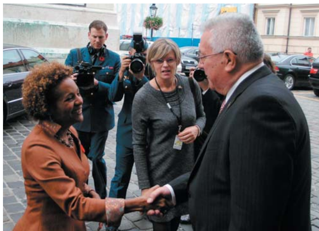
Predsjednik Bebić primio glavnu guvernerku Kanade Michaëlle Jean

U srdačnom i prijateljskom razgovoru predsjednik Sabora Bebić i kanadska glavna guvernerka Jean izrazili su zadovoljstvo razvojem odnosa Hrvatske i Kanade, koji su u snažnom usponu. Glavna je guvernerka posjet predsjednika Sabora Kanadi u lipnju 2009. godine ocijenila uspješnim izrazivši zadovoljstvo što je njen posjet Hrvatskoj uslijedio u relativno kratkom vremenu nakon toga. „Važno je imati česte posjete na visokoj državnoj razini”,