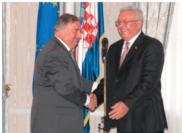
Predsjednik Bebić razgovarao s predsjednikom Senata Francuske Gérardom Larcherom

(Zagreb, 12. listopada 2009.) Francuska želi pomoći Hrvatskoj da što brže i lakše uđe u članstvo Europske