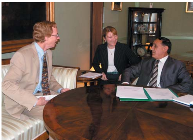
Nazif Memedi primio austrijskog veleposlanika Jana Kickerta

Izraelski veleposlanik informirao je Gorana Marića o tijeku završnih priprema pred nadolazeći posjet predsjednika Hrvatskoga sabora Luke Bebića s izaslanstvom Izraelu. Naglasio je da je taj posjet izuzetno važan, ne samo gledajući njegovu parlamentarnu dimenziju, već i kao davanje vjetra u leđa gospodarskoj suradnji, koja nije na zadovoljavajućoj razini. Izrazio je uvjerenje da upravo parlamenti mogu potaknuti bolje odnose među zemljama i u njih unijeti osim političkih sadržaja i one gospodarske. Izvijestio je i o prošlotjednom posjetu Izraelu Predsjednika Republike Hrvatske Stjepana Mesića i dogovorima o projektima od zajedničkog interesa, posebice uspostavljanju direktnih letova između Hrvatske i Izraela. Također, istaknuta je mogućnost organizacije seminara za poslovne ljude iz Hrvatske i Izraela kako bi se vidjelo koje su mogućnosti za gospodarsku suradnju i investiranje, odnosno za koje su proizvode i usluge zainteresirani jedni i drugi. Potencijali za suradnju između Hrvatske i Izraela golemi su, ona je moguća u znanosti i tehnologiji, medicinskim istraživanjima, farmaceutskoj industriji, turizmu, poljoprivrednoj tehnologiji, sustavu navodnjavanja, naglasio je Amrani.