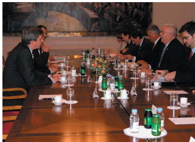
Predsjednik Bebić i predsjednik Odbora za vanjsku politiku Sejma poljskog parlamenta

Dvojica dužnosnika su razgovarala o odnosima Poljske i Hrvatske, koji se razvijaju na obostrano zadovoljstvo.