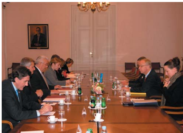
Predsjednik Bebić primio supredsjedatelja Zajedničkog parlamentarnog odbora RH-EU Gunnara Hökmarka

Zastupnik EP-a Hökmark izrazio je zadovoljstvo ovogodišnjim Izvješćem Europske komisije o napret-