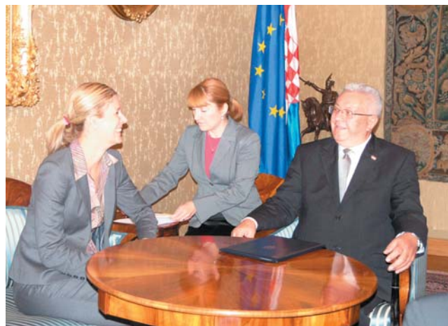
Predsjednik Bebić i potpredsjednica Europskog parlamenta Silvana Koch-Mehrin

Potpredsjednica EP-a Silvana Koch-Mehrin izrazila je zadovoljstvo Izvješćem o napretku Hrvatske u ispunjavanju kriterija za članstvo u EU, kao i zadovoljstvo time što će Hrvatska uskoro postati 28. članica Unije. Upozorila je na važnost uloge nacionalnih parlamenata, kao i održavanja tijesnih veza s njima kako bi se umanjio dosadašnji demokratski deficit unutar EU-a, a što bi trebalo biti ispravljeno stupanjem Lisabonskog ugovora na snagu. Posebno je istaknula koli-