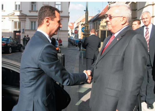
Predsjednik Bebić dočekuje predsjednika Sirijske Arapske Republike Bashara Al-Assada

Predsjednik Hrvatskoga sabora Luka Bebić i predsjednik Sirije Bashar Al-Assad na kraju su razgovora razmijenili i mišljenja o sigurnosno-političkoj situaciji na Bliskom istoku.