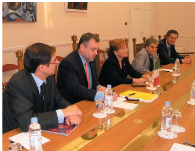
Vesna Pusić s izaslanstvom talijanskog Senata