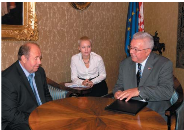
Predsjednik Bebić primio veleposlanika Ukrajine Borisa Zajčuka

(Zagreb, 1. listopada 2009.) Predsjednik Hrvatskoga sabora Luka Bebić primio je u nastupni posjet veleposlanika Ukrajine u Republici Hrvatskoj Borisa Zajčuka.