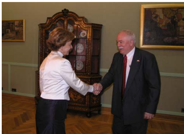
Vesna Pusić s kanadskim veleposlanikom Edwinom Loughlinom

Predsjednica Nacionalnog odbora zaželjela je dobrodošlicu u Hrvatsku kanadskom veleposlaniku i zahvalila