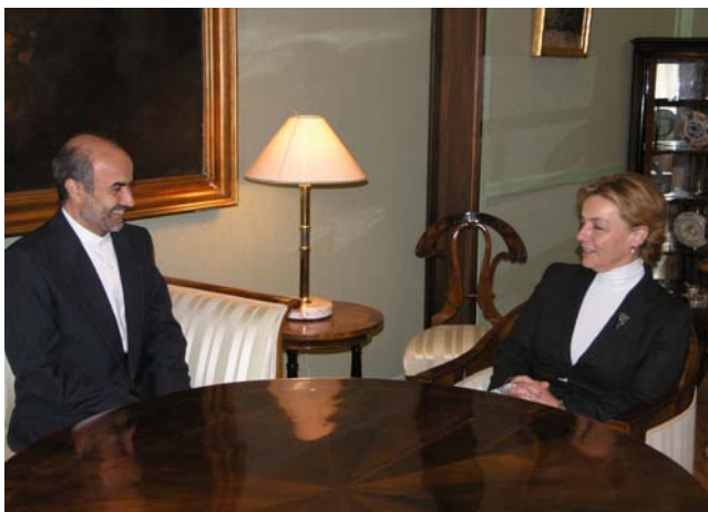
Vesna Pusić s iranskim veleposlanikom

Sugovornici su u nastavku razgovarali o predstojećim predsjedničkim izborima u Hrvatskoj. Veleposlanik Fadaifard čestitao je Vesni Pusić na kandidaturi za predsjedničke izbore, a razmijenjena su i stajališta o mogućnostima za ulazak u drugi krug predsjedničkih izbora.