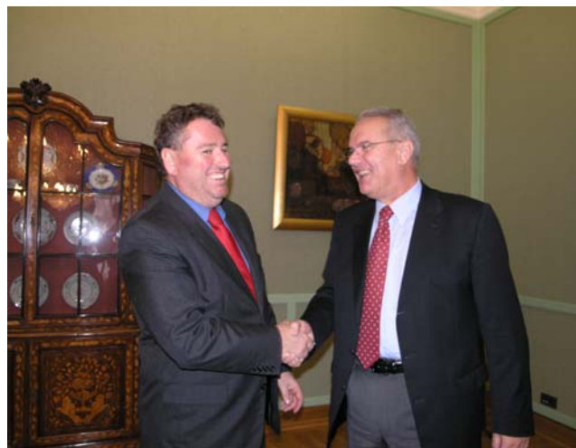
Potpredsjednik Mimica s mađarskim veleposlanikom