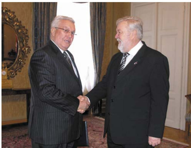
Predsjednik Sabora primio u opštajni posjet slovenskog veleposlanika Milana Orožena Adamiča

Razgovarali su o ukupnim bilateralnim odnosima, a posebice o Sporazumu o arbitraži kojeg su postigli hrvatska predsjednica Vlade Jadranka Kosor i slovenski premijer Borut Pahor.