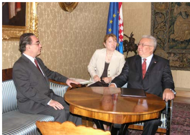
Predsjednik Sabora primio u nastupni posjet veleposlanika Čilea

U razgovoru je izražena želja za daljnjim jačanjem tradicionalno prijateljskih odnosa Hrvatske i Čilea prije