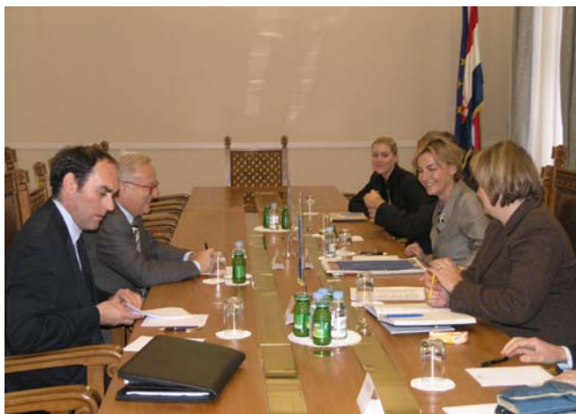
Vesna Pusić i Hannes Swoboda

ljem za Republiku Hrvatsku u Europskom parlamentu Hannesom Swobodom.