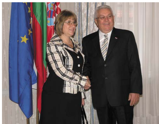
Predsjednik Bebić primio predsjednicu bugarskog Narodnog sabora Cecku Cačevu

(Zagreb, 11. studenoga 2009.) – Iskustva Hrvatske i Bugarske u pregovorima s Europskom unijom, te jačanje parlamentarne suradnje u okviru EU bile su glavne teme razgovora koje su predsjednik Hrvatskoga sabora Luka