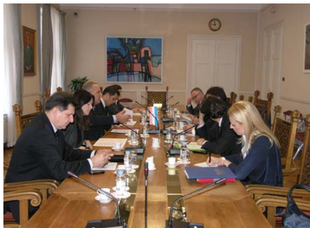
Potpredsjednik Mimica primio izaslanstvo Odbora za međunarodne odnose i europske integracije Skupštine Crne Gore