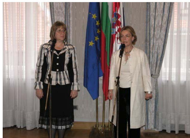
Vesna Pusić i predsjednica bugarskoga parlamenta

U Bugarskoj je Odbor za europske integracije imao vodeću ulogu u usklađivanju bugarskog zakonodavstva s europskim i kao oblik parlamentarne kontrole čitavog pregovaračkog procesa imao je uvid u čitav tijek pregovora, a po primanju Bugarske u članstvo Unije taj odbor je prerastao u Odbor za europske poslove. Usklađeno je više od 700 zakona s europskim zakonodavstvom i direktivama, a najzahtjevnija područja pregovora bila su pra-