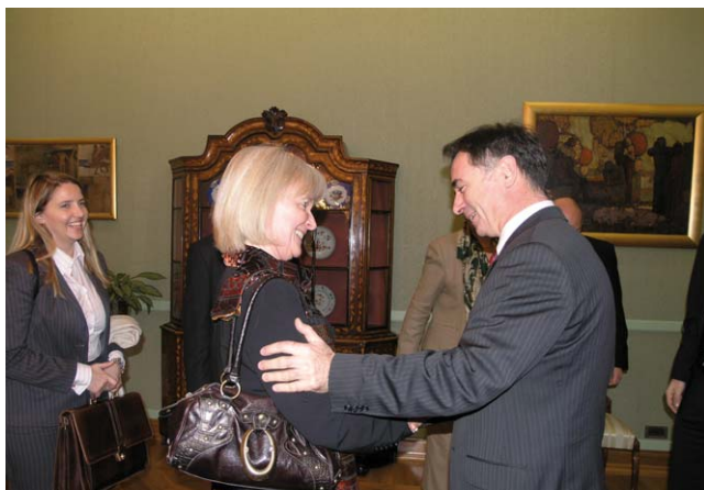
Milorad Pupovac i državna tajnica u Ministarstvu vanjskih poslova Kraljevine Norveške Elisabeth Walaas

(Zagreb, 24. siječnja 2008.) Čestitavši gospođi Walaas na novoj dužnosti, Milorad Pupovac prisjetio se njezinog prethodnog angažmana kao veleposlanice Kraljevine Norveške u Republici Hrvatskoj. U uvodnom dijelu sastanka razgovaralo se o novoj Vladi Republike Hrvatske u kojoj je na dužnost potpredsjednika Vlade imenovan pripadnik srpske nacionalne manjine Slobodan Uzelac. Državna tajnica Kraljevine Norveške Elisabeth Walaas naglasila je da je mjesto potpredsjednika Vlade za regionalni razvoj, obnovu i povratak dobar pokazatelj kontinuiranog rada na poboljšanju položaja nacionalnih manjina u Republici Hrvatskoj.