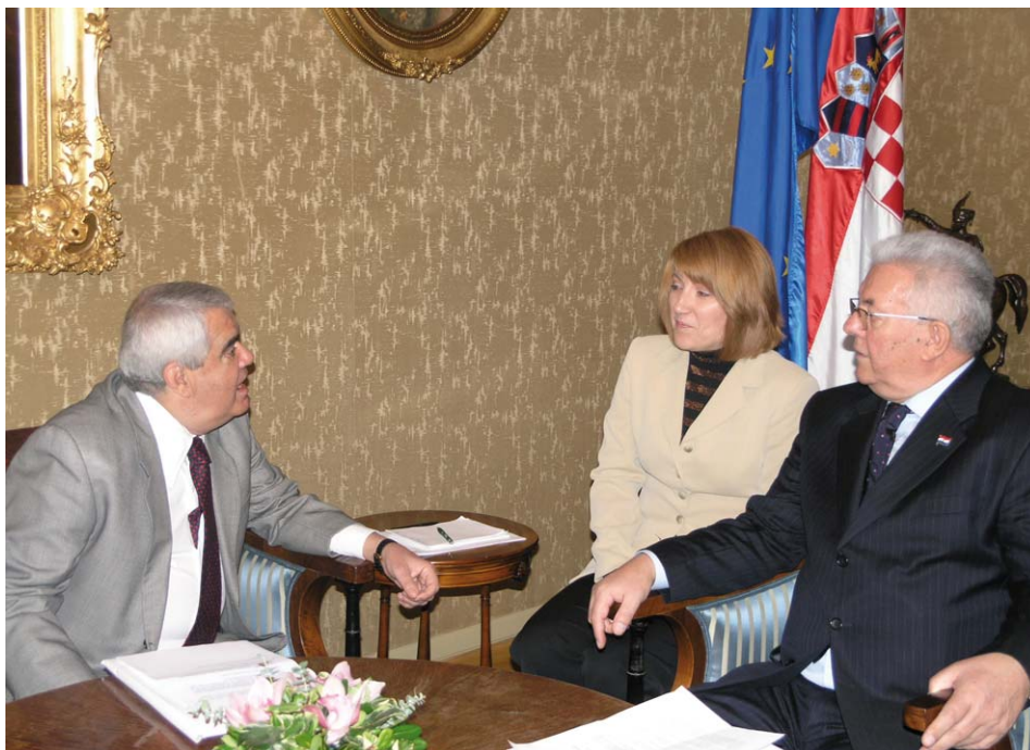
Predsjednik Sabora primio brazilskog veleposlanika Valladaa

(Zagreb, 24. siječnja 2008.) Predsjednik Hrvatskog sabora Luka Bebić primio je u nastupni posjet veleposlanika Savezne Republike Brazil Harolda Valladaa, s kojim je razgovarao poglavito o mogućnostima jačanja parlamentarne i gospodarske suradnje dviju država.