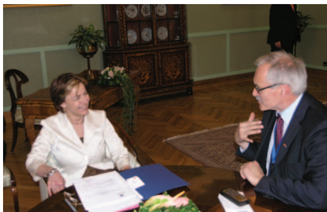
Vesna Pusić sastala se s njemačkim državnim ministrom za Europu Gloserom

(Zagreb, 15. travnja 2008.g.) Predsjednica Nacionalnog odbora za praćenje pregovora o pristupanju Hrvatske EU Vesna Pusić primila je u radni posjet državnog ministra za Europu Ministarstva vanjskih poslova Savezne Republike Njemačke Güntera Glosera.