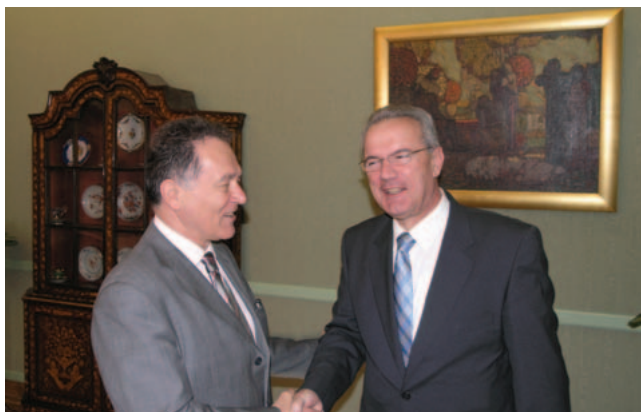
Potpredsjednik Sabora Neven Mimica primio crnogorskog veleposlanika Branka Lukovca

(Zagreb, 17. travnja 2008.g.) Potpredsjednik Hrvatskoga sabora i predsjednik Odbora za europske integracije Neven Mimica primio je u radni posjet veleposlanika Republike Crne Gore u Republici Hrvatskoj Branka Lukovca.