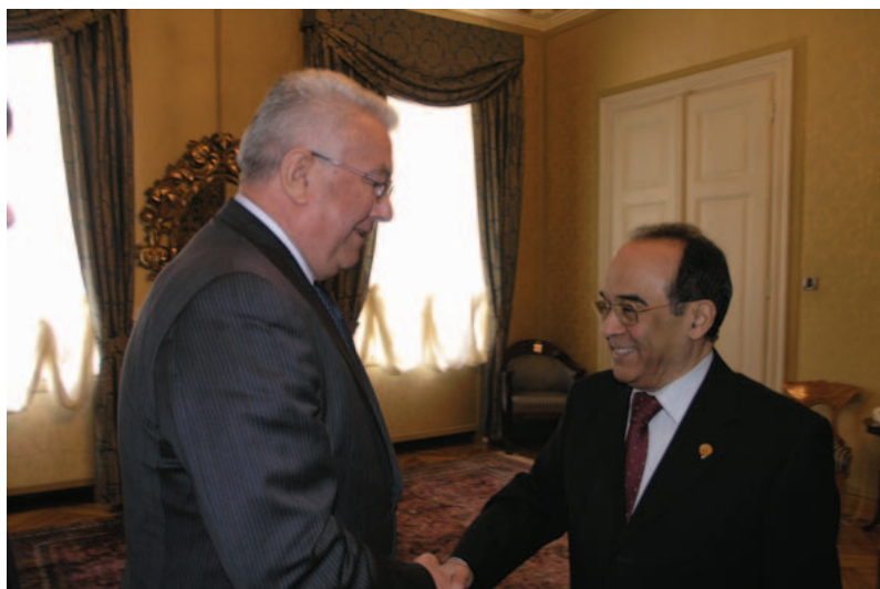
Predsjednik Sabora Luka Bebić sastao se s veleposlanikom Kuvajta Abdulaziza Abdullaha Al-Duaija

U razgovoru je sa zadovoljstvom zaključeno kako postoji obostrani interes za tješnju gospodarsku suradnju, te da bi zbog toga trebalo razmotriti mogućnost otvaranja rezidentnih veleposlanstava obiju država. Kuvajt je u više navrata iskazao interes za ulaganjima u RH u