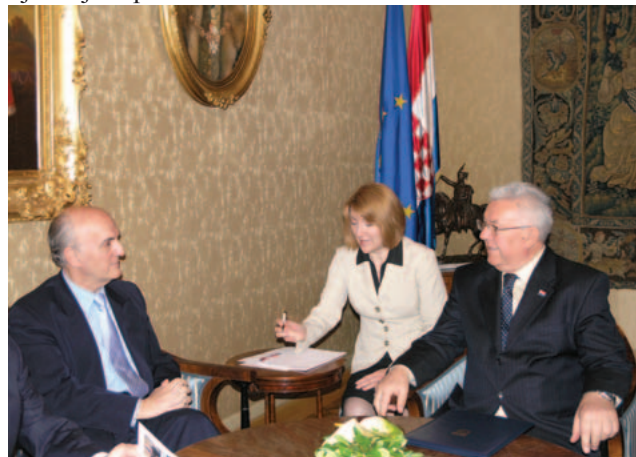
Predsjednik Sabora Luka Bebić susreo se s šefom Misije OEES-a u Republici Hrvatskoj Jorgeom Fuentesom

Dvojica su dužnosnika izrazila uvjerenje da će nastavak suradnje s Uredom OEES-a u Zagrebu do kraja 2008. godine uroditi uspješnim rješavanjem preostalih pitanja u vezi s procesuiranjem ratnih zločina i stambenim zbrinjavanjem povratnika.