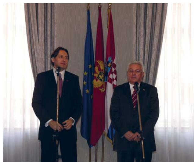
Izjava za medije predsjednika Sabora Luke Bebića i predsjednika Skupštine Crne Gore Ranka Krivokapića

brzo biti punopravna članica EU-a, kazao je novinarima Krivokapić koji boravi u uzvratnom službenom posjetu RH. „Hrvatska nastavlja svoj ubrzani put prema EU i osobno mislim da, unatoč tome što je rok 2010. godina, da Hrvatska toliko brzo ide da bi mogao biti i neki raniji rok. Crna Gora ostaje pri odlučnosti da u ovoj godini preda zahtjev za članstvo u EU”, istaknuo je Krivokapić.