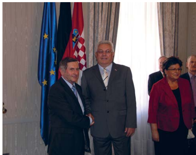
Predsjednik Sabora Luka Bebić primio predsjednika Bavarskog pokrajinskog parlamenta Aloisa Glücka

(Zagreb, 19. lipnja 2008.) Izaslanstvo bavarskog parlamenta poduprlo je u Zagrebu plan Vlade i Sabora da dovrši pristupne pregovore do jeseni iduće godine kako bi Hrvatska što skorije ušla u Europsku uniju. „Vladu i Sabor podupiremo na putu u EU kako bi se sve završilo iduće jeseni. Siguran sam da zadaće koje predstoje možete obaviti i da ćemo se na kraju zajedno naći u Uniji”, rekao je predsjednik bavarskog parlamenta Alois Glück nakon sastanka s predsjednikom Hrvatskog sabora Lukom Bebićem. Po njegovim riječima, to je povijesna prilika i zadatak Sabora i Vlade koji se rijetko događaju