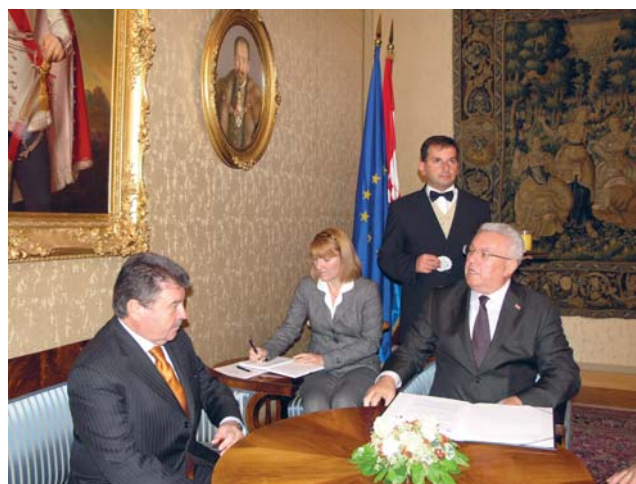
Predsjednik Hrvatskog sabora Luka Bebić s veleposlanikom Portugala

U razgovoru s veleposlanikom Luisom Barreirosom predsjednik Hrvatskoga sabora Bebić je zahvalio na njegovom doprinosu produbljenju odnosa Hrvatske i Portu-