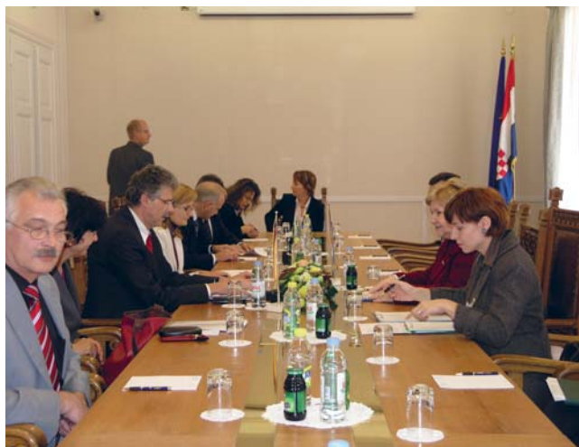
Dragica Zgrebec i dužnosnici njemačkog Bundestaga

Središnje teme sastanka bile su reforme i usklađivanje zakonodavstva s pravnom stečevinom EU na području poljoprivrede. Dragica Zgrebec rekla je kako je do danas na području poljoprivrede učinjeno mnogo, no preostalo je još nekoliko reformi koje su u tijeku i koje su bitne za podizanje konkurentnosti hrvatske poljoprivredne proizvodnje, kao i njezin opstanak na zahtjevnom europskom tržištu. Kako je većina ratnih razaranja pogodila upravo poljoprivredne regije, a veličina pojedinačnog poljoprivrednog zemljišta je još uvijek ispod europskog prosjeka, Hrvatska je zatražila prijelazna razdoblja kako bi se ovaj segment gospodarstva kvalitetno restrukturirao i prilagodio. Osim navedenih reformi, predsjednica Odbora za poljoprivredu, ribarstvo i ruralni razvoj Dragica Zgrebec dodala je da nam predstoji i usklađivanje statističkih podataka te preoblikovanje sustava poticaja. Zastupnik Dragutin Bodakoš posebno je istaknuo potrebu aktiviranja velikih, još uvijek neobrađenih površina. Voditelj Odbora za prehranu, poljoprivredu i zaštitu potrošača njemačkog Bundestaga Manfred Helmut Zöllmer zahvalio je na dobivenim informacijama te je istaknuo kako Hrvatska ima vrlo dobre perspektive za jačanje i razvoj svoje poljoprivredne proizvodnje.