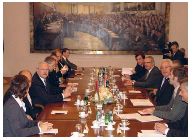
Predsjednik Sabora Bebić s predsjednikom Slovačke Republike Gašparovičem