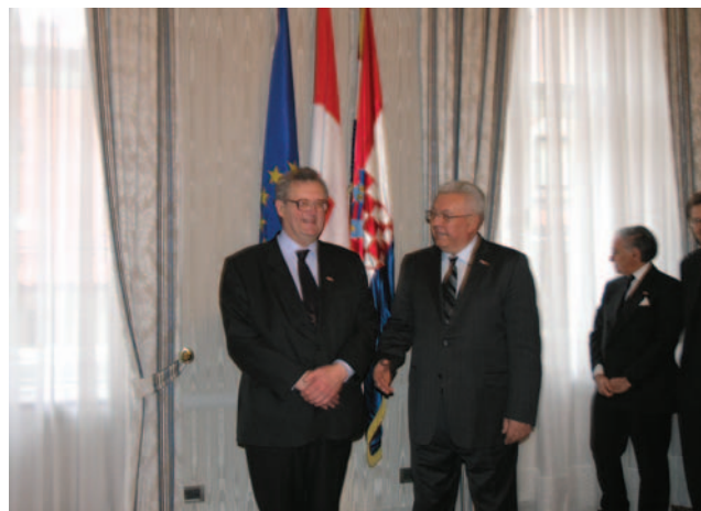
Predsjednik Sabora primio Princa i Velikog Meštra Suverenog viteškog Malteškog reda fra Matthewa Festinga

Princ i Veliki meštar Suverenog viteškog Malteškog reda fra Matthew Festing je izrazio svoje osobno veliko zadovoljstvo što će imati priliku vidjeti mnoge promjene do kojih je došlo nakon njegovog zadnjeg posjeta Hrvatskoj. U vezi s mogućnošću osnivanja nacionalne asocijacija