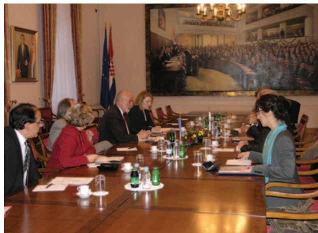
Visoki povjerenik za nacionalne manjine OESS-a Knut Vollebaek susreo se sa zastupnicima nacionalnih manjina u Hrvatskome saboru

Zaključno se zastupnik Šemso Tanković osvrnuo na problem uporabe religijskog imena za etničku odrednicu pripadnika bošnjačke nacionalne manjine.