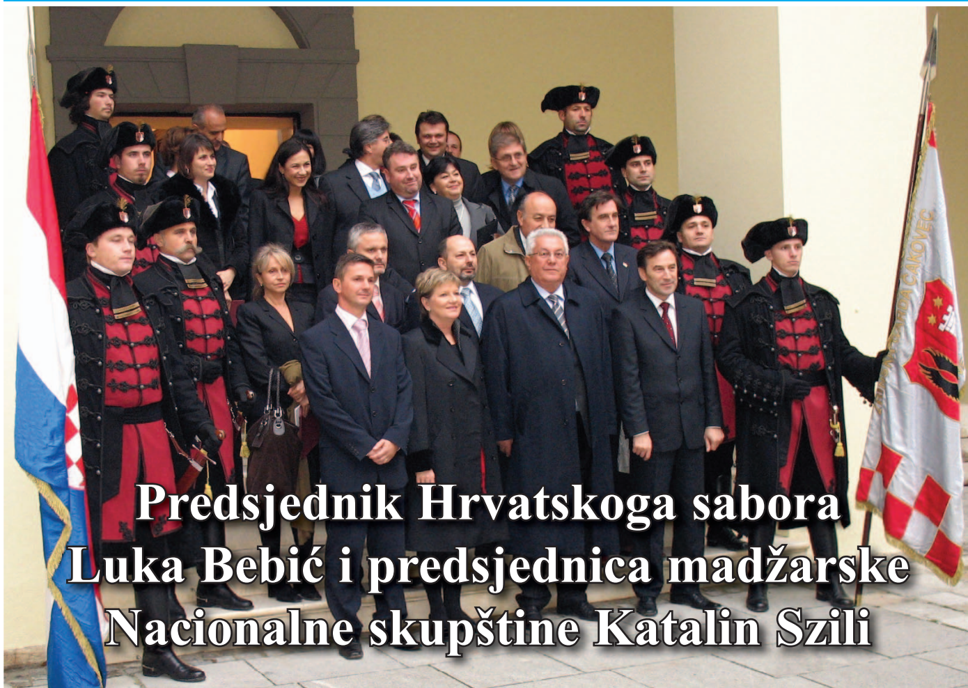
Predsjednik Hrvatskoga sabora Luka Bebić i predsjednica mađarske Nacionalne skupštine Katalin Szili