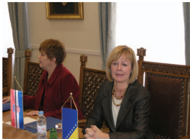
Potpredsjednica Sabora Željka Antunović primila izaslanstvo Parlamentarne skupštine BiH

Na sastanku se razgovaralo o važnosti sudjelovanja žena u političkom životu obje zemlje, a posebice u zakonodavnoj vlasti. Predsjednik Povjerenstva za ostvariva-