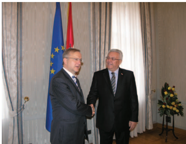
Predsjednik Hrvatskoga sabora Luka Bebić i europski povjerenik za proširenje EU Olli Rehn

Europski povjerenik za proširenje EU Rehn je izrazio zadovoljstvo što postoji suglasnost oko perspektive ula-