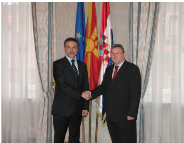
Potpredsjednik Hrvatskoga sabora Vladimir Šeks i predsjednik Republike Makedonije Branko Crvenkovski

Potpredsjednik Hrvatskoga sabora Neven Mimica rekao je kako i u procesu pristupanja EU Hrvatska i Makedonija imaju izvrsnu suradnju. Osvrnuvši se na