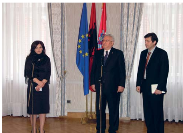
Predsjednik Hrvatskoga sabora Bebić i predsjednica Parlamenta Republike Albanije Topalli

Bebić i Topalli složili su se da je bilateralna suradnja između dviju zemalja vrlo uspješna i izrazili su nadu da će se i dalje tako razvijati na svim poljima. „Jako nismo izravni susjedi, vrlo smo bliski i naši odnosi su izvanredni”, ocijenio je Bebić. Topalli je na kraju zahvalila predsjedniku Sabora na pomoći i potpori koju Hrvatska pruža Albaniji.