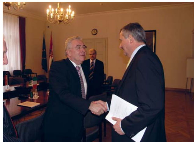
Predsjednik Odbora za vanjsku politiku sastao se s Odborom za europske poslove irskog parlamenta

Razgovaralo se i o ekonomskoj budućnosti Europske unije s obzirom na aktualnu gospodarsku krizu.