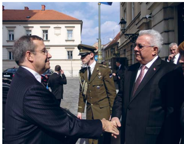
Predsjednik Sabora Luka Bebić i estonski predsjednik Toomas Hendrik Ilves

(Zagreb, 17. ožujka 2009.) Predsjednik Hrvatskoga sabora Luka Bebić primio je predsjednika Republike Estonije Toomasa Hendrika Ilvesa, koji u Hrvatskoj boravi u službenom posjetu. Dvojica su dužnosnika razgovarali o ukupnim bilateralnim odnosima koji su ocijenjeni kao prijateljski, te o proširenju Europske unije i NATO-a. Predsjednik Hrvatskoga sabora Luka Bebić zahvalio je Estoniji na kontinuiranoj podršci ulasku Hrvatske u Europsku uniju i NATO, izvijestivši estonskog predsjednika