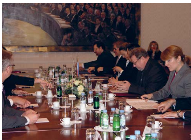
Vladimir Šeks s izaslanstvom Odbora za europske poslove parlamenta Kraljevine Švedske

(Zagreb, 25. ožujka 2009.) „Mi mislimo da Hrvatska pridonosi našoj kolektivnoj sigurnosti i obrani. Hrvatska