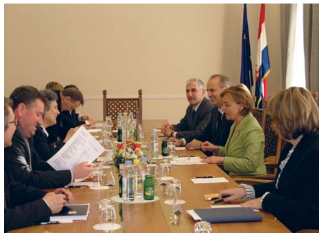
Vesna Pusić s ministricom vanjskih poslova Mađarske Kingom Göncz

(Zagreb, 13. ožujka 2009.) Odnosi Hrvatske i Mađarske su iznimno bogati i prijateljski, složile su se sugovornice na početku sastanka. Osim vrlo dobre parlamentarne suradnje, dvije države blisko surađuju i na području energetike, infrastrukturne izgradnje te na nizu ekoloških projekata. Vesna Pusić zahvalila je Mađarskoj na jasnoj i konzistentnoj potpori Hrvatskoj na njezinom