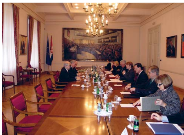
Predsjednik Luka Bebić i izaslanstvo Zajedničkog odbora za europske poslove irskog parlamenta

Predsjednik izaslanstva Zajedničkog odbora za europske poslove Parlamenta Irske Bernard Durkan potvrdio je da Irska i dalje podržava proširenje Europske unije, te je izrazio uvjerenje da će Lisabonski sporazum proći na ponovljenom referendumu, koji bi se u Irskoj trebao održati u drugoj polovici ove godine. Kazao je kako su političari svjesni da moraju preuzeti odgovornost u tome, te su sve političke stranke spremne voditi snažnu kampanju koja bi pridonijela pozitivnom ishodu referenduma. Vlada i uvjerenje da su na rezultat referenduma prvi utjecali domaći politički problemi, recesija, ali i činjenica da se ljudi ne identificiraju s eu-