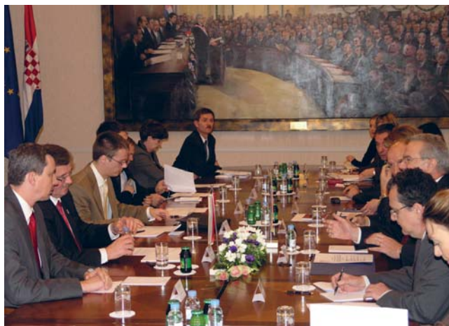
Dužnosnici u Hrvatskom saboru s predsjednikom poljskog parlamenta

Predsjednik parlamenta Republike Poljske Komorowski rekao je da Hrvatska i Poljska imaju tradicionalno prijateljske i dobre odnose. Međuparlamentarnu suradnju ocijenio je dobrom, ali i primijetio da postoji prostor za njezino intenziviranje. Izrazio je uvjerenje da će ta suradnja postati još dinamičnija od vremena kad Hrvatska postane punopravna članica EU. „Imamo slične interese, ali i iskustva, jer su oba društva prošla komunističke režime i bila u komunističkim državama, a sada su obje države izrazito orijentirane europskim integracijama”, rekao je Komorowski. Primijetio je da postoji velik interes poljskih turista za dolazak na hrvatski Jadran.