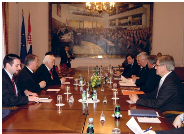
Predsjednik Hrvatskoga sabora Luka Bebić razgovarao s predsjednikom Odbora za vanjsku politiku Narodne skupštine Republike Srbije Dragoljubom Mićunovićem

Izrazivši zadovoljstvo svojim dolaskom u Hrvatsku predsjednik Odbora za vanjske poslove srbijanske Narodne skupštine Dragoljub Mićunović obavijestio je predsjednika Hrvatskoga sabora kako je u Narodnoj skupštini formirana skupina prijateljstva za suradnju s