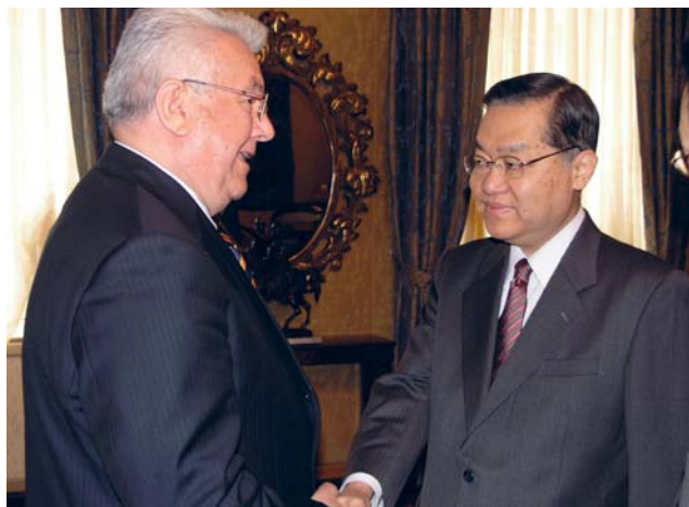
Luka Bebić primio u posjet veleposlanika Japana Tetsuhisu Shirakawu

tim više što je riječ o vrlo dugotrajnom i opsežnom problemu. Podržao je i uspostavu tješnje parlamentarne suradnje koja bi mogla potaknuti nove zajedničke projekte i tako još više pridonijeti razvoju odnosa između Hrvatske i Japana.