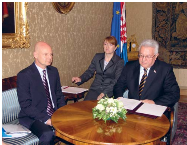
Luka Bebić i voditelj Ureda UNHCR-a u RH Wilfried Buchhorn

Predsjednik Hrvatskoga sabora Luka Bebić i šef Ureda UNHCR-a u Republici Hrvatskoj Wilfried Buchhorn