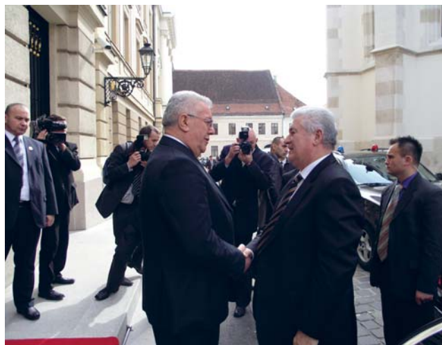
Predsjednik Sabora Luka Bebić i predsjednik Republike Moldove Vladimir Voronin

Predsjednik Sabora podržao je nastavak suradnje Hrvatske i Moldove u cilju stabilizacije cjelokupne regije,