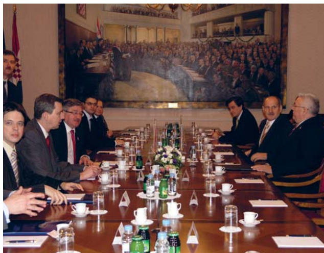
Predsjednik Hrvatskoga sabora primio predsjednika Sejma Republike Poljske

Predsjednici hrvatskog i poljskog parlamenta razgovarali su o bilateralnim odnosima, koje su ocijenili „dobrim i prijateljskim”, a posebice o daljnjem razvoju parlamentarne suradnje. Poseban naglasak u razgovorima dan je pristupašnju Hrvatske NATO-u i Europskoj uniji, u čemu Hrvatska