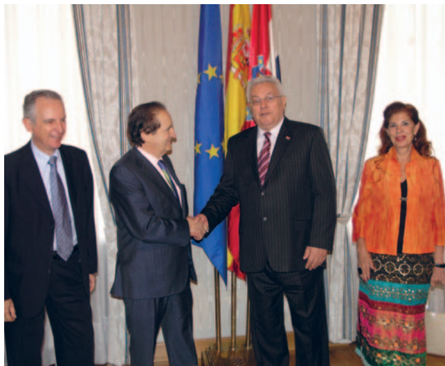
Predsjednik Hrvatskoga sabora Luka Bebić primio drugog potpredsjednika španjolskog Senata Juana Joséa Lucasa Giméneza

Gimenez je predsjedniku Hrvatskoga sabora uputio i poziv za uzvratni posjet španjolskom Senatu. „Mislim