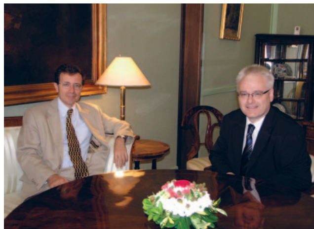
Ivo Josipović primio francuskog veleposlanika Jérômea Pasquiera

(Zagreb, 22. srpnja 2009.) Središnje teme sastanka bile su trenutna gospodarska situacija, pristupanje Hrvatske Europskoj uniji te položaj Hrvatske u regiji. Veleposlanik Pasqu-