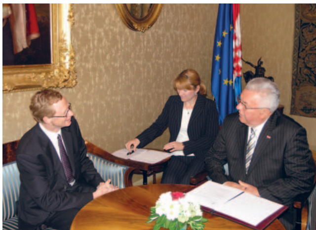
Predsjednik Hrvatskoga sabora Luka Bebić razgovarao s veleposlanicima Francuske Republike, Republike Austrije i Crne Gore

(Zagreb, 14. srpnja 2009.) Predsjednik Sabora i ruski veleposlanik bili su suglasni u ocjeni da su ukupni bilateralni odnosi zadnjih godina u usponu na svim područjima, ali i da ima još prostora za suradnju. Posebno zadovoljstvo izrazili su razvojem suradnje hrvatskog i ruskog parlamenta. Izražen je obostrani interes za pojačanom suradnjom na području energetike, brodogradnje i turizma. Osobito je važno da politički odnosi između Hrvatske i Rusije nisu pretrpjeli izmjene ni nakon ulaska Hrvatske u punopravno članstvo NATO-a, a predsjednik Sabora Bebić je izrazio očekivanje da će politička i gospodarska suradnja Hrvatske i Rusije i u predstojećem razdoblju nastaviti slijediti uzlaznu putanju.