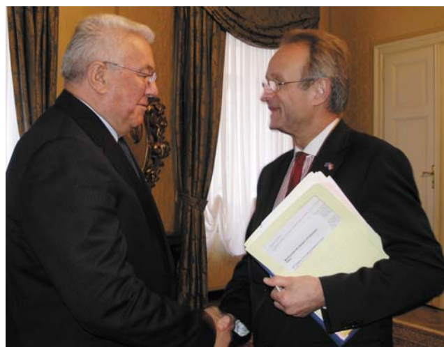
Predsjednik Bebić primio u nastupni posjet šefa Delegacije EU u RH Paula Vandorena

Predsjednik Sabora je šefa Delegacije EU u RH izvijestio da je ovaj saziv hrvatskog parlamenta u sklopu usklađivanja hrvatskog zakonodavstva s europskim