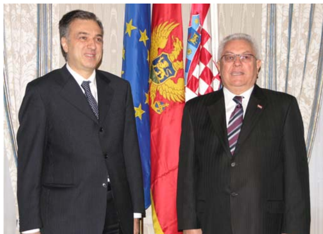
Predsjednik Bebić primio predsjednika Crne Gore Filipa Vujanovića

Predsjednik Sabora pozdravio je ulazak Crne Gore u Akcijski plan za članstvo u NATO-u (MAP) u prosincu 2009. godine, za što se Hrvatska snažno zauzimala. Crnogorskog je predsjednika izvijestio o tijeku pretpripremih pregovora Hrvatske s EU, posebice o problemima s kojima se Hrvatska suočava na području poljoprivrede, brodogradnje i pravosuđa.