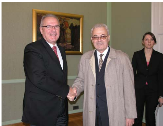
Potpredsjednik Mimica primio državnog tajnika ministarstva vanjskih poslova Republike Mađarske Vilmosa Szaboa

skoj uniji. Potpredsjednik Hrvatskoga sabora Neven Mimica predstavio je gostima aktivnosti parlamenta na području harmonizacije hrvatskoga zakonodavstva s pravnom stečevinom Europske unije, istaknuvši pritom da će biti zaključen ovogodišnji plan za donošenje „europskih zakona“.