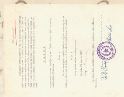
Odluka o promjeni naziva iz ZAVNOH u Narodni sabor

During the Second World War within the anti-fascist movement State Anti-fascist Council for the People's Liberation of Croatia (ZAVNOH) performed supreme, legislative and executive function. In 1945 ZAVNOH enacted the name National Parliament of Croatia emphasizing historic continuity of Croatian sovereignty.