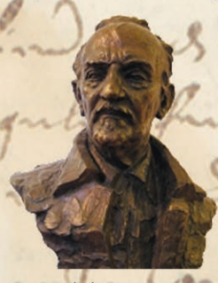
Vladimir Nazor, predsjednik Sabora 1945. godine