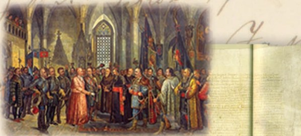
Cetinski sabor 1527. godina