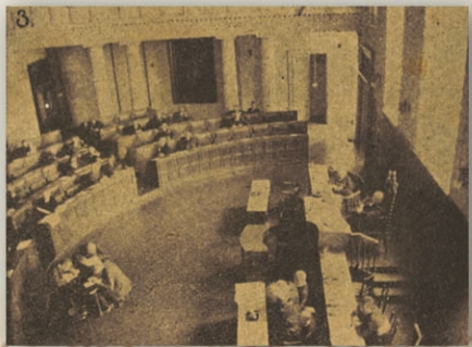
Sabor iz 1918. godine

During the war, 29 October 1918 the Parliament reached a decision to dissolve the century-old relations with Austro-Hungarian Empire and had not held a session until the Second World War.