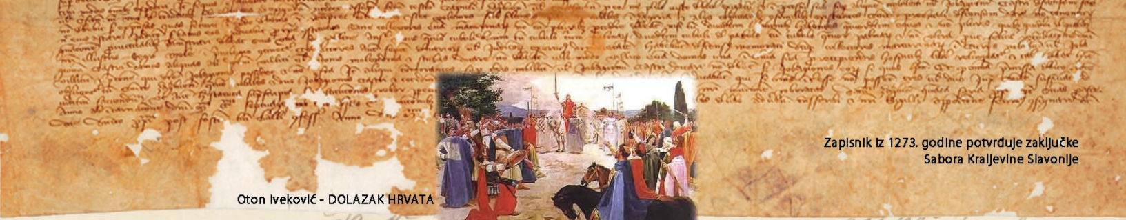
Zapisnik iz 1273. godine potvrđuje zaključke Sabora Kraljevine Slavonije