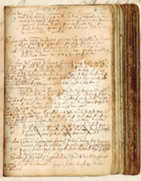
Zapisnik Sabora iz 1557.

From the mid 16th century Croatian - Dalmatian Parliament and the Slavonian Parliament sat as a unique Parliament of the Kingdom of Croatia-Slavonia in order to organize better defence from the Ottoman threat.