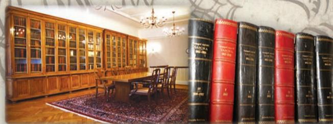
Stenografski zapisnici u Hrvatskom saboru

Škrinja povlastica kolijevka je Zemaljskog arhiva, ustanove koju je Sabor osnovao 1870. god. i čijim radom započinje moderno razdoblje čuvanja i pohranjivanja saborskih spisa.