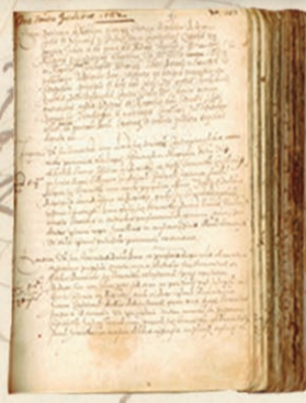
Zapisnik Sabora iz 1582.