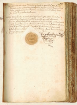
Zapisnik Sabora iz 1585.

Sabor Trojedne Kraljevine Hrvatske, Dalmacije i Slavonije koji se sastao 5. lipnja 1848. god. znamenit je kao prvo zasjedanje modernoga zastupničkog Sabora.