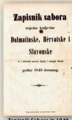
Zapisnik Sabora iz 1848.

The Parliament of the Tripartite Kingdom of Croatia-Dalmatia-Slavonia assembled on 5 June 1848, famous for being the first modern representative parliament.