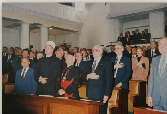
Konstituirajuća sjednica Sabora 30. svibnja 1990. godine

Nakon slobodnih, višestranačkih demokratskih izbora, 30. svibnja 1990. god. konstituiran je prvi demokratski Hrvatski sabor koji je stoljetne težnje mnogih naraštaja okrunio odlukom o državnoj samostalnosti i nezavisnosti.