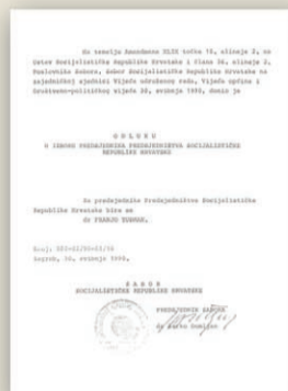
Odluka s konstituirajuće sjednice Sabora o imenovanju dr. Franje Tuđmana predsjednikom Predsjedništva Socijalističke Republike Hrvatske

After free, multiparty, democratic elections first democratic Croatian Parliament was constituted on 30 May 1990 expressing centuries-old aspirations by generations of Croatian people for sovereignty and independence.