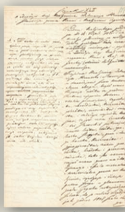
Koncept tzv. Članka 42.

In 1861 the Parliament adopted the so called Article 42 stating that Hungary had to recognize the territorial integrity of the Tripartite Kingdom and its autonomy within worship, judiciary, education and administration.