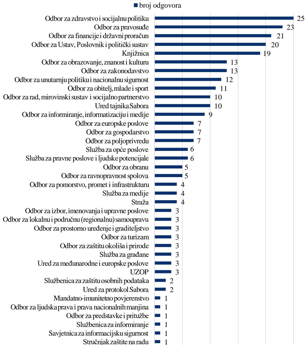
Graf 5: Broj odgovorenih upita po odborima/službama/uredima

Uz već uobičajeno visok interes parlamenata za poslovničke teme, pitanja koja se tiču parlamentarnog rada, te pravosudna pitanja, koja su već niz godina najzastupljenija, u 2023. godini vidljiv je porast zanimanja za zdravstvena, socijalna i financijska pitanja. Tako su brojčano upite riješili, sukladno svom djelokrugu rada i postavljenim pitanjima, sljedeći saborski odbori, službe i uredi, kako je prikazano u grafu 5.