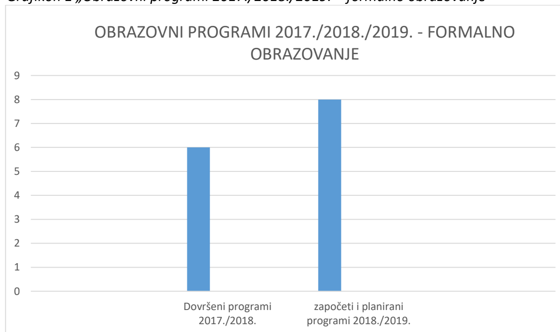
Grafikon 1 „Obrazovni programi 2017./2018./2019. – formalno obrazovanje“

Na temelju redovnog praćenja i analize podataka koje provodi Hrvatska olimpijska akademija, vidljivo je povećanje broja programa osposobljavanja kadrova za potrebe sporta u organizaciji Hrvatske olimpijske akademije. Hrvatska olimpijska akademija programe osposobljavanja i usavršavanja kadrova za potrebe sporta provodi isključivo putem školarina – sredstava polaznika, odnosno bez korištenja državnih financijskih sredstava.