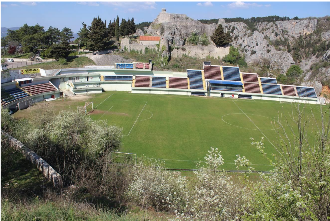
Slika 1: Igralište Gospin Dolac u Imotskom