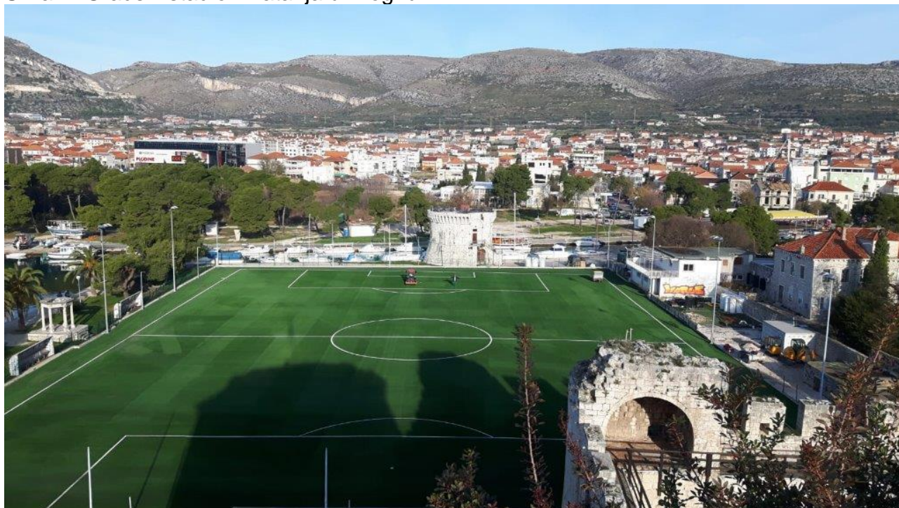
Slika 4: Gradski stadion Batarija u Trogiru