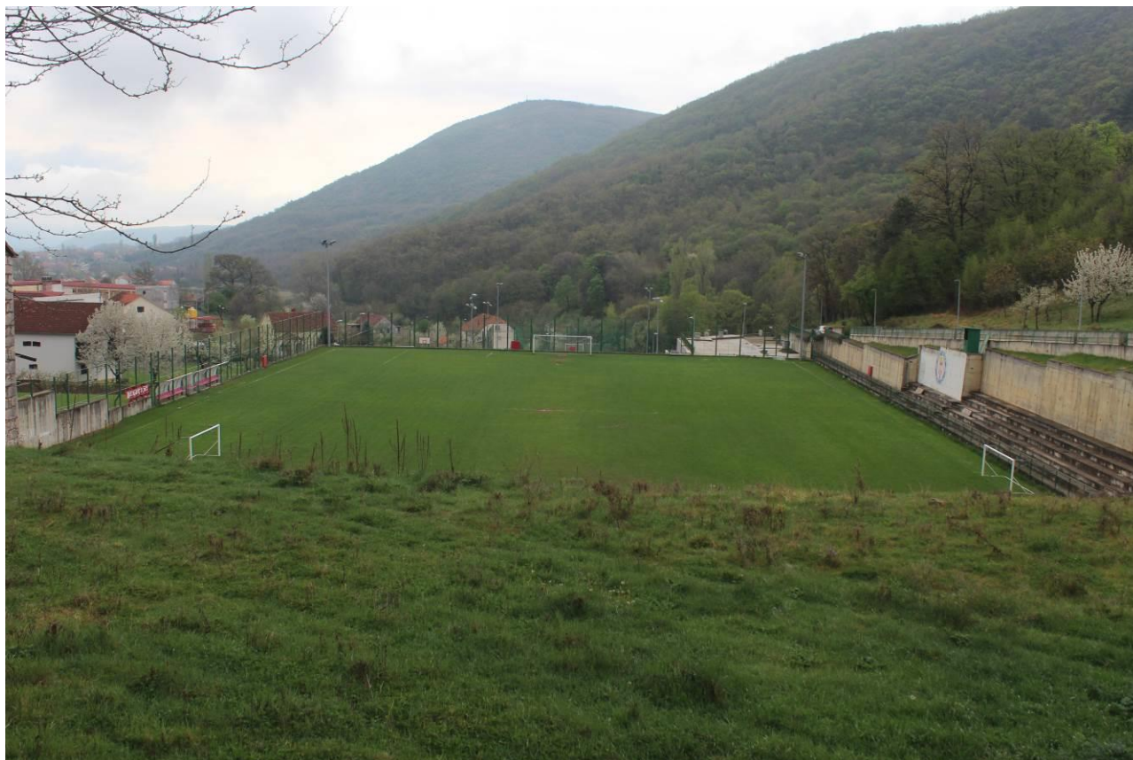
Slika 3: Igralište Česma u Vrlici