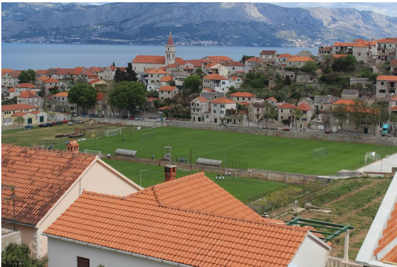
Slika 2: Igralište Polježice Postira