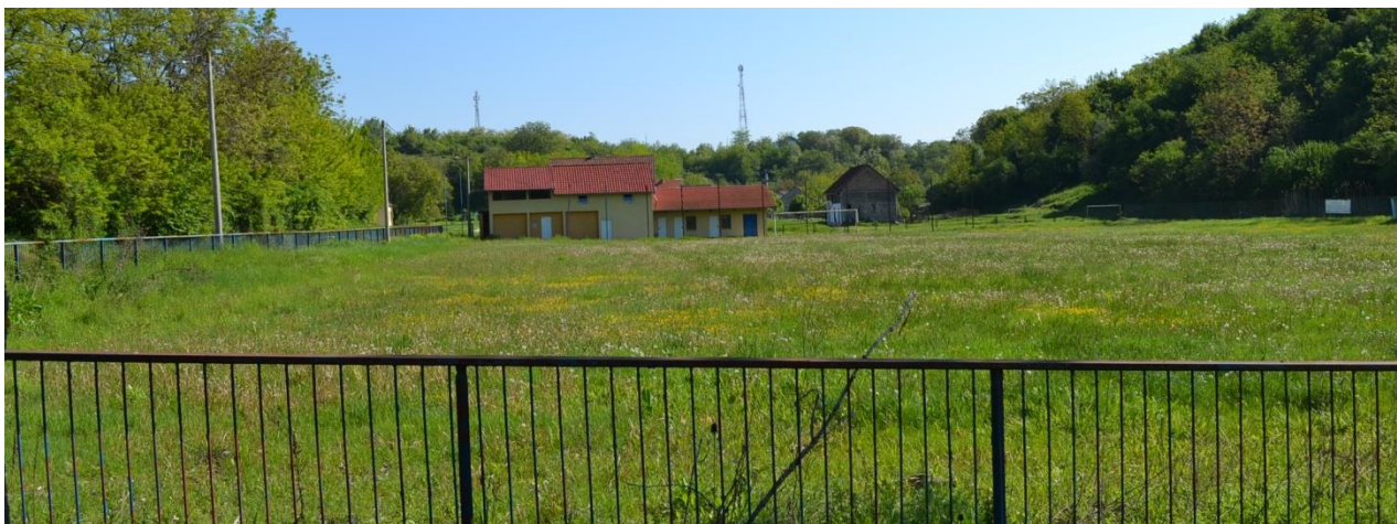
Slika 4: Igralište Opatovac na području Općine Lovas

Igralište Opatovac na području Općine Lovas čine dvije katastarske čestice u katastarskoj općini Opatovac, katastarska čestica broj 1571 površine 13 481 m 2 na kojoj su zgrade i koje je vlasnik Općina Lovas i katastarska čestica broj 1236 površine 31 905 m 2 na kojoj je teren za igru i na kojoj suvlasnički dio od 1/2 ima Općina Lovas i od 1/2 Republika Hrvatska. Zahtjev za izdavanje isprave podobne za upis vlasništva na spomenutoj nekretnini Općina Lovas nije podnijela Ministarstvu državne imovine.