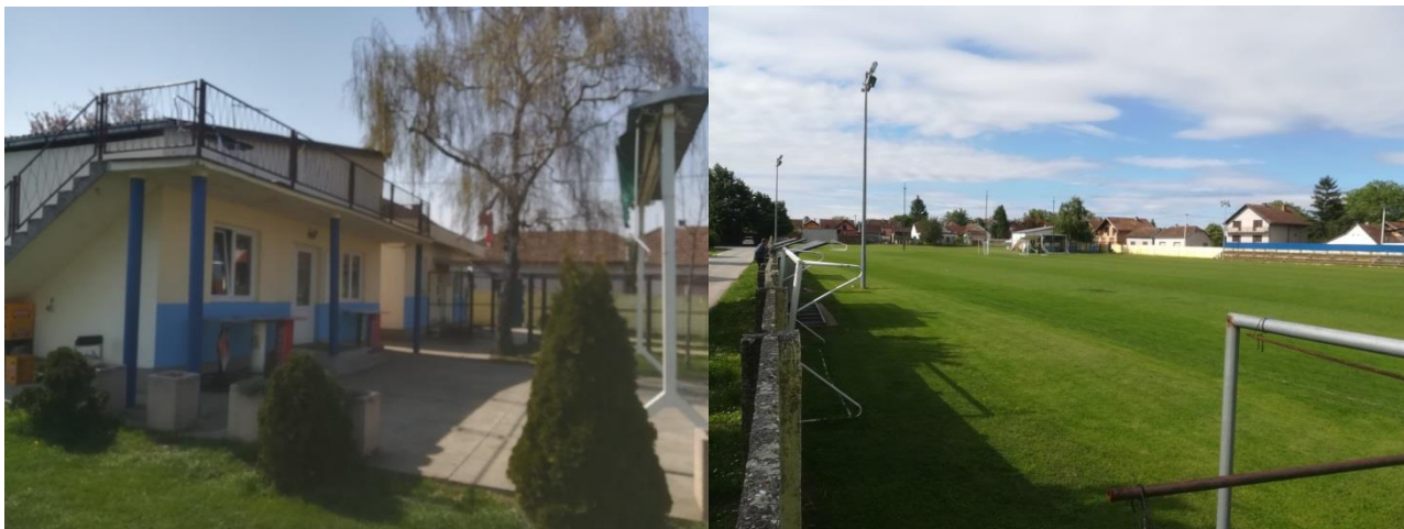
Slika 3: Igralište Tomislav Bošnjak u Iloku