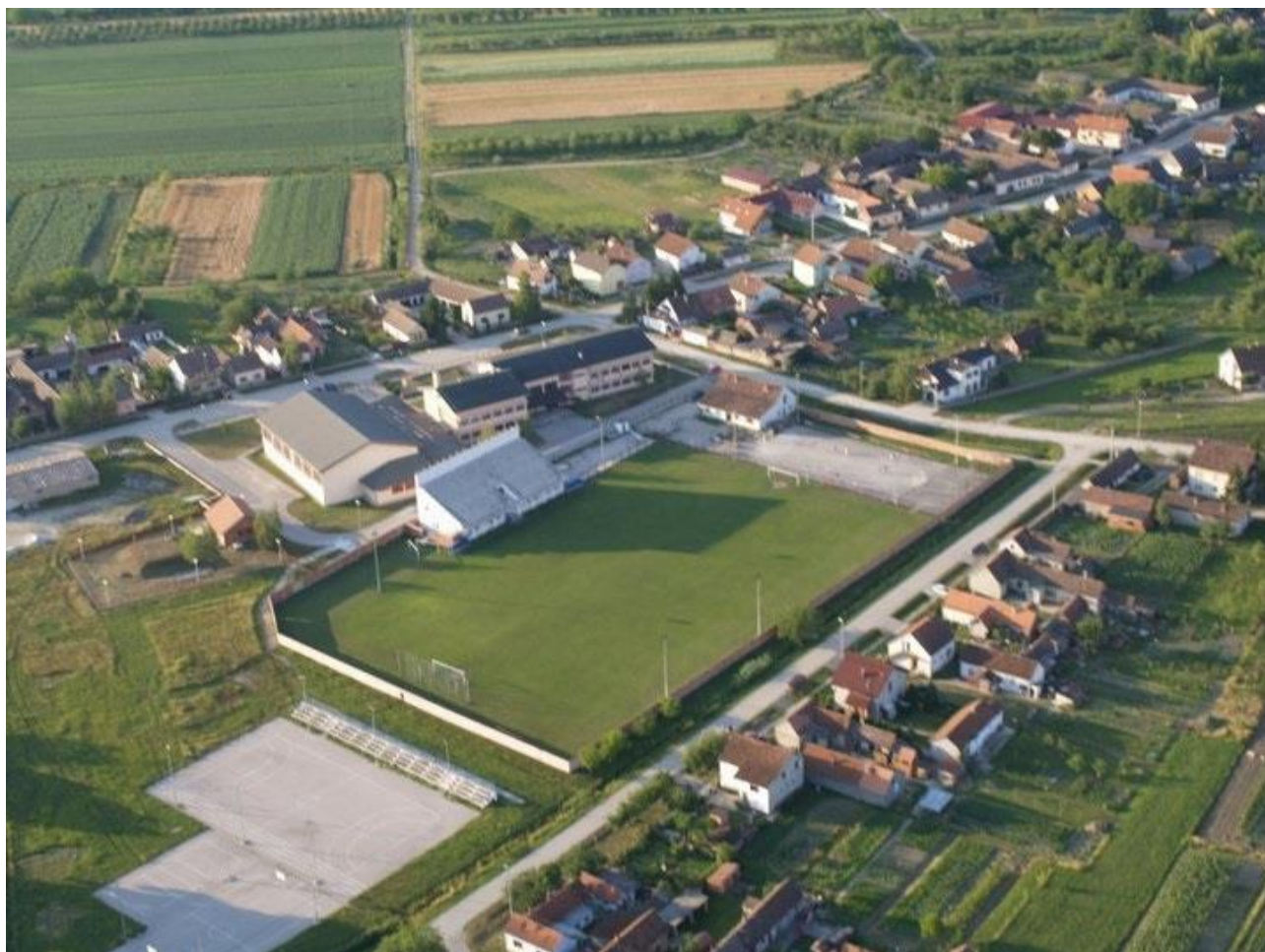
Slika 6: Stadion Ljese na području Općine Gradište