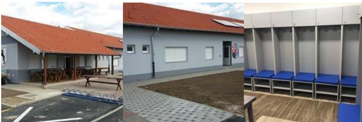
Slika 10: Rekonstrukcija i dogradnja zgrade Igrališta NK Frankopan na području Općine Andrijaševci