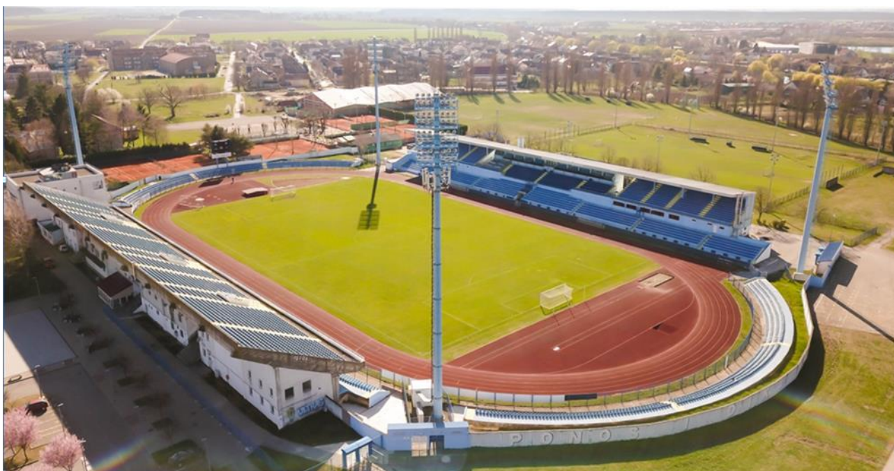
Slika 7: Stadion HNK Cibalia u Vinkovcima