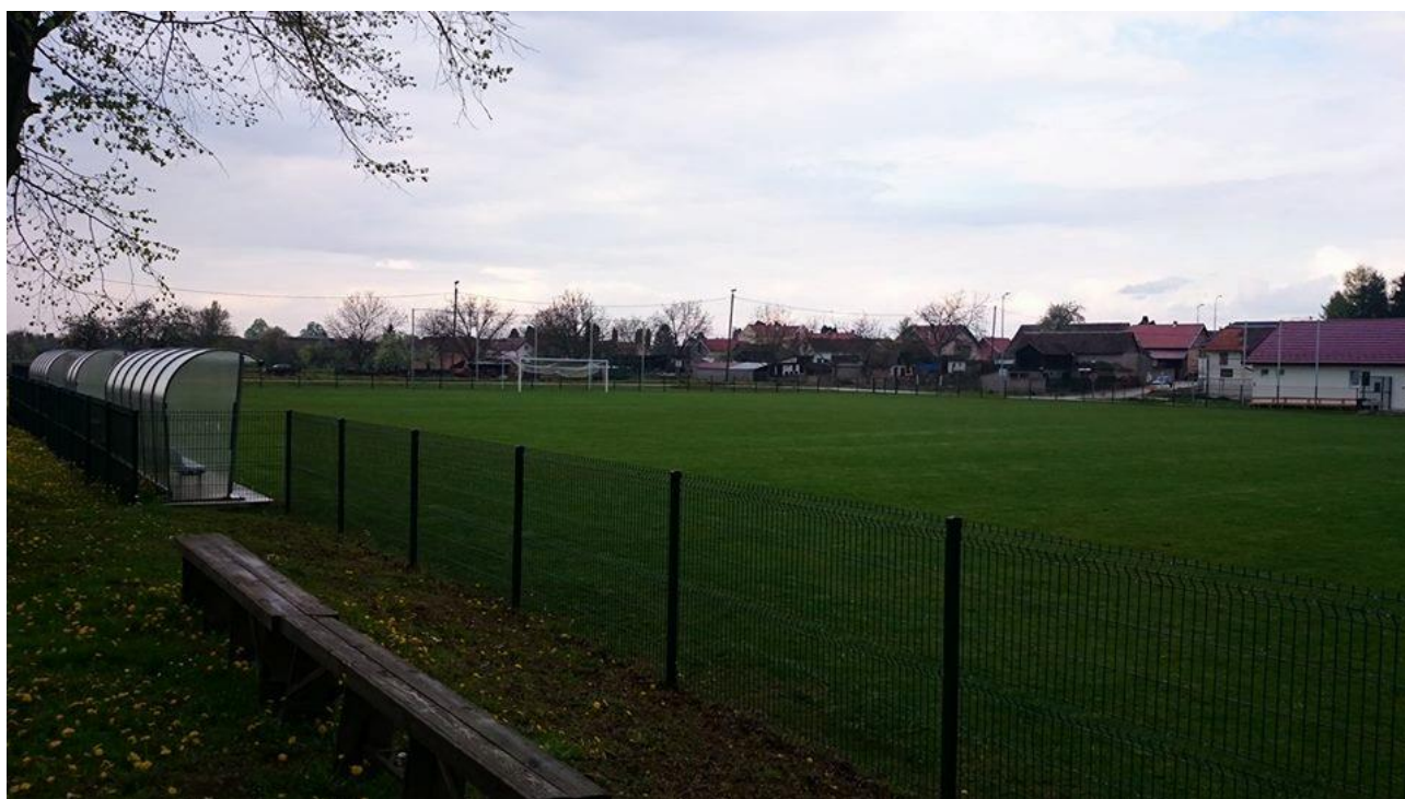
Slika 5: Igralište Račinovci na području Općine Drenovci

Općina Drenovci je odluku donijela u 2017., a prema odluci nogometna igrališta (igrališta Drenovci, Posavski Podgajci, Račinovci i Rajevo Selo) daju se na upravljanje nogometnim klubovima. Odlukom su utvrđeni poslovi upravljanja i održavanja sportskih građevina (redovito održavanje, tekuće i investicijsko, zaštita i osiguranje građevine, određivanje i provođenje reda te kontrola korištenja sportske građevine), a upravljanje se može prekinuti odlukom vlasnika, prestankom rada nogometnog kluba, ako se sportskom građevinom ne koristi pažnjom dobrog gospodara i u drugim opravdanim razlozima. Na temelju navedene odluke i ugovora zaključenih u 2017., nogometna igrališta dana su na upravljanje i korištenje na neodređeno vrijeme bez naknade.