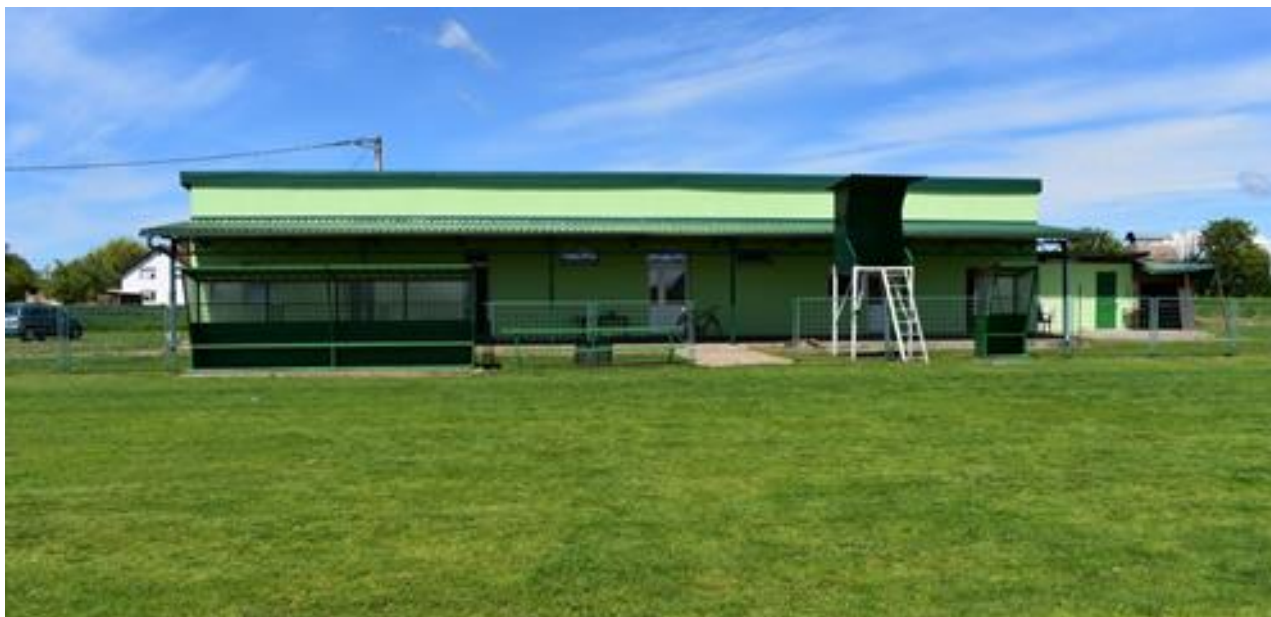
Slika 8: Energetska obnova zgrade na Igralištu Nijemci