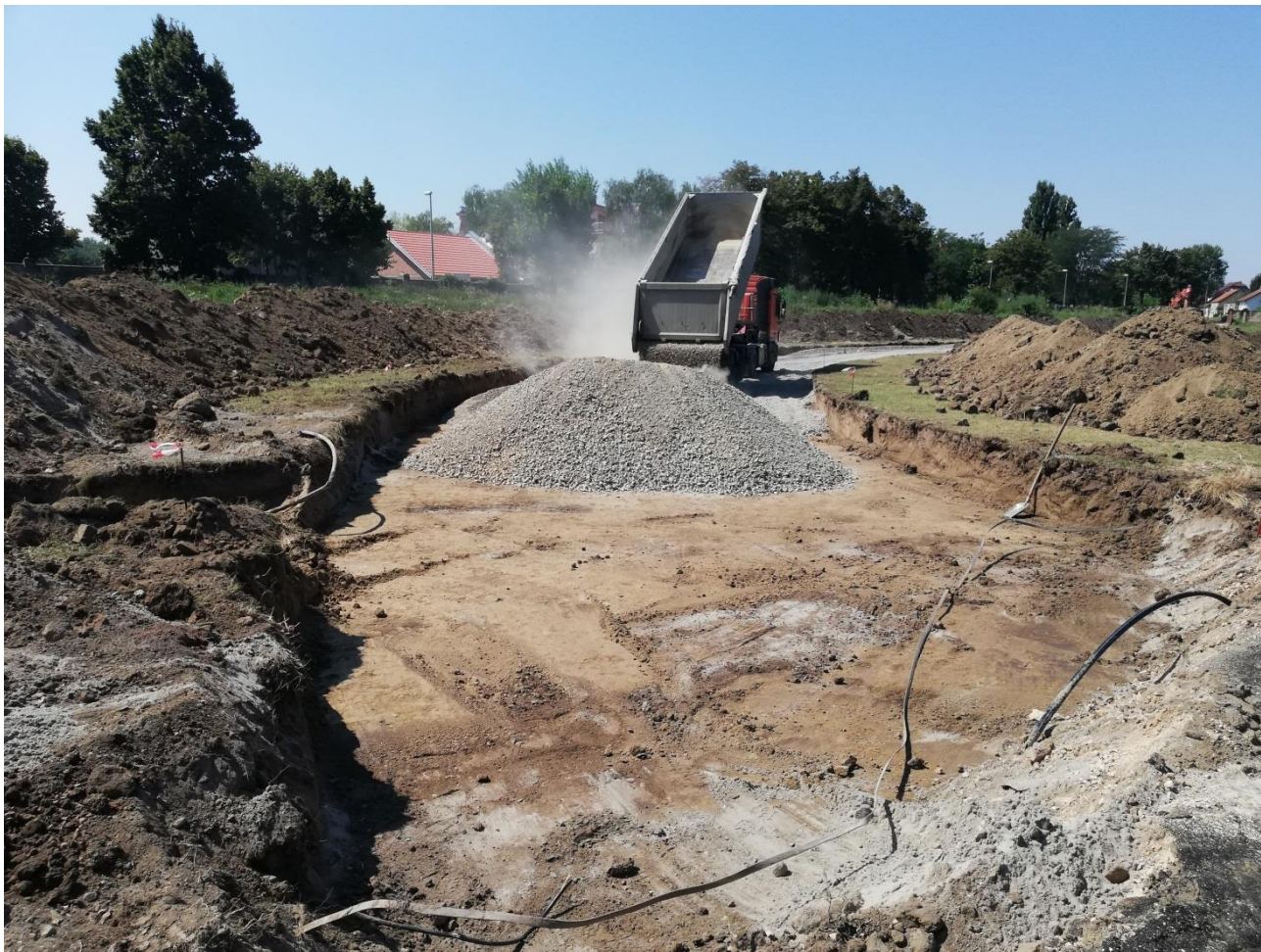
Slika 9: Rekonstrukcija atletske staze na Igralištu HNK Vukovar 1991