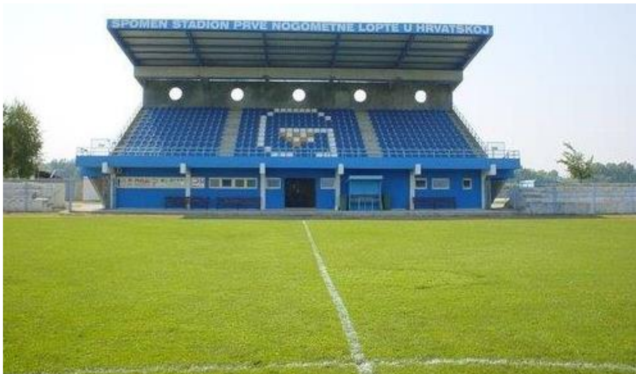
Slika 1: Stadion Prve nogometne lopte u Županji