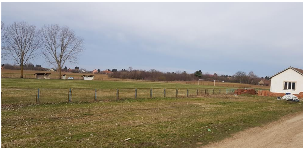
Slika 2: Igralište Berak na području Općine Tompojevci

Igralište Berak, na području Općine Tompojevci, smješteno na katastarskoj čestici 1035/4 površine 13 201 m 2 u katastarskoj općini Berak, u vlasništvu je Republike Hrvatske. Općina Tompojevci je u 2016. podnijela Državnom uredu za upravljanje državnom imovinom zahtjev za darovanje nekretnine na kojoj se nalazi nogometno igralište te građevina (svlačionica) izgrađena prije Domovinskog rata, za koji općina posjeduje uporabnu dozvolu i koji za potrebe odigravanja nogometnih utakmica u županijskoj ligi koristi NK Sokol Berak. U 2018. općina je Ministarstvu državne imovine uputila požurnicu sa zamolbom da se ubrza rješavanje zahtjeva, jer je NK Berak prešao u viši rang natjecanja zbog čega se mora nadograditi postojeći objekt. Do vremena obavljanja revizije (svibanj 2019.) postupak po podnesenom zahtjevu nije okončan.