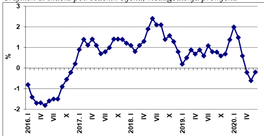
Grafikon 2. Indeks potrošačkih cijena, međugodišnja promjena