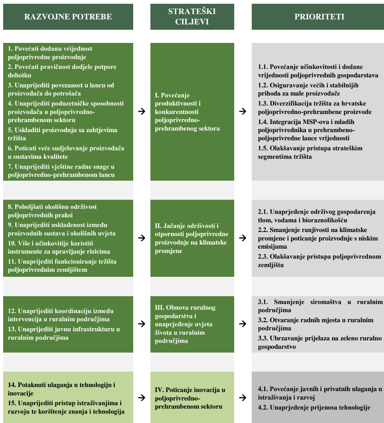
Slika 1.: Odnos između razvojnih potreba, strateških ciljeva i prioriteta poljoprivredno-prehrambenog sektora

U Dodatku I. daje se za svaki strateški cilj pregled veza s pojedinim provedbenim mehanizmima, koji se detaljnije obrađuju u idućem poglavlju, i razvojnih potreba.